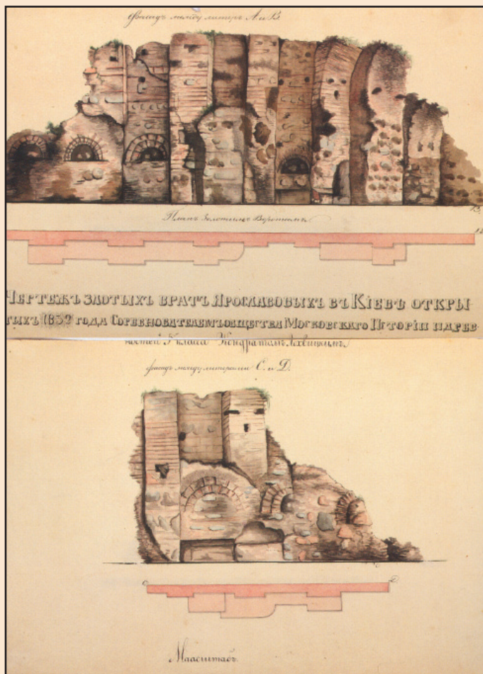
Іл. 8. Креслення Золотих воріт. 1830-ті рр. (За: Епоха антикваріат. Живопис XIX–XXI сторіччя та колекційний антикваріат пов'язаний з історією міста Києва. Аукціон № 23. Київ, 25 травня 2013 р.)

воротам. Саме з цієї причини, складаючи через кілька років після відкриття «Описание найденных Древностей в Киеве при раскрытии Золотых ворот, Десятинной, Крестовоздвиженской, Ильинской и Св. Ирины Церквей», він, порушивши хронологію відкриттів, поставив Золоті ворота на перше місце і більш того, вказав деякі знахідки, свого часу не згадані ані у щоденнику, ані в інших документах (іл. 8).