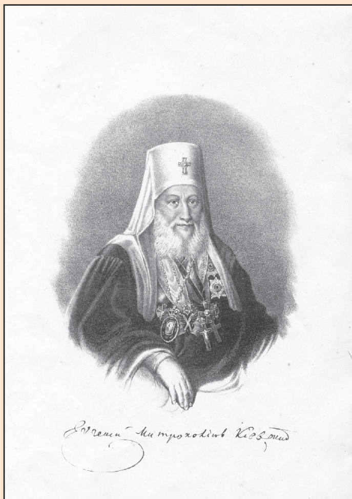
Іл. 2. Митрополит Київський і Галицький Євгеній (Болховітінов)

Лохвицький був, мабуть, головною особою в історії відкриття Воріт, і виявився очевидцем/свідком надзвичайно упередженим, емоційним, що безумовно позначилося на його щоденникових записах, оцінках і інтерпретації подій, що відбувалися. Проте саме його насичений суб'єктивністю щоденник наближає до розуміння цілком об'єктивних реальних речей, обставин, чинників, які зумовили саме такий, а не інший розвиток подій. Лохвицький інколи говорить, а інколи проговорюється, інколи дуже старан-