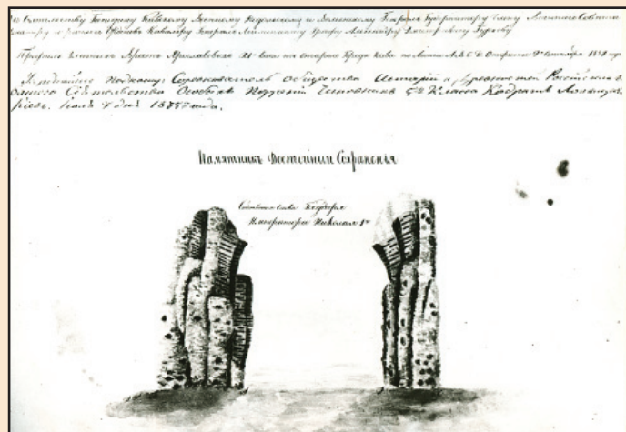
Іл. 4. Золоті ворота з північної сторони. Мал. К. Лохвицького. 1835 р.

Кошторис був готовий вже наступного дня. Лохвицький нарахував за «совершенное [тобто повне. – Т.А.] открытие Золотых ворот 5000 руб.» і обіцяв впорати-