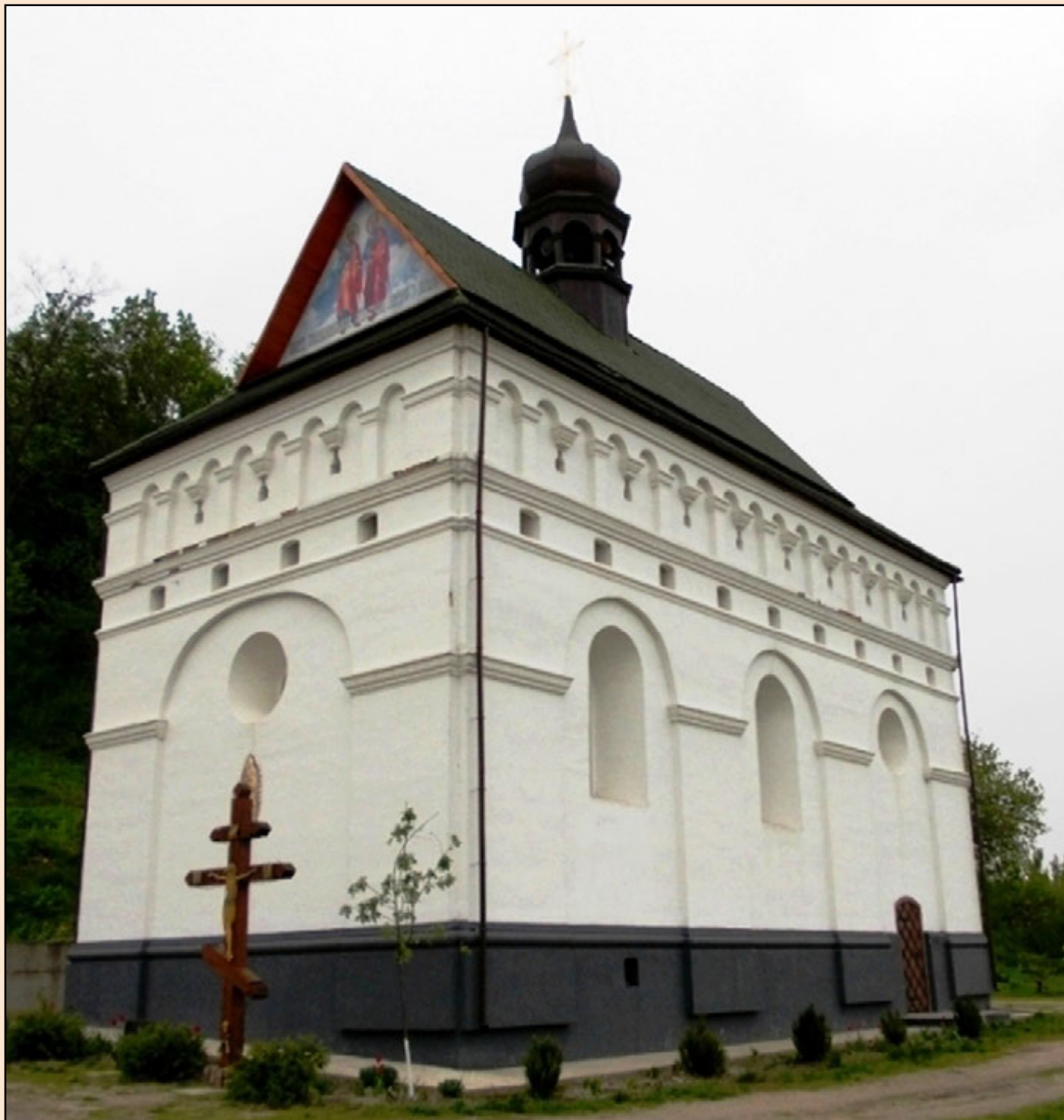
Іл. 3. Новозбудована церква Петра і Павла.

Над автентичними підмурками церкви було вирішено зробити накриття (павільйон), що дозволить зберегти фундаменти, які будуть доступні для відвідувачів. За аналог слугувала споруда над підмурками кам'яниці Хмельницьких XVII ст. у с. Суботів (іл. 4). Навколо давніх фундаментів церкви було влаштовано канали для стрічкового фундаменту залізобетонних стін павільйону. Роботи розпочато ще 2006 року., але станом на 2007 рік