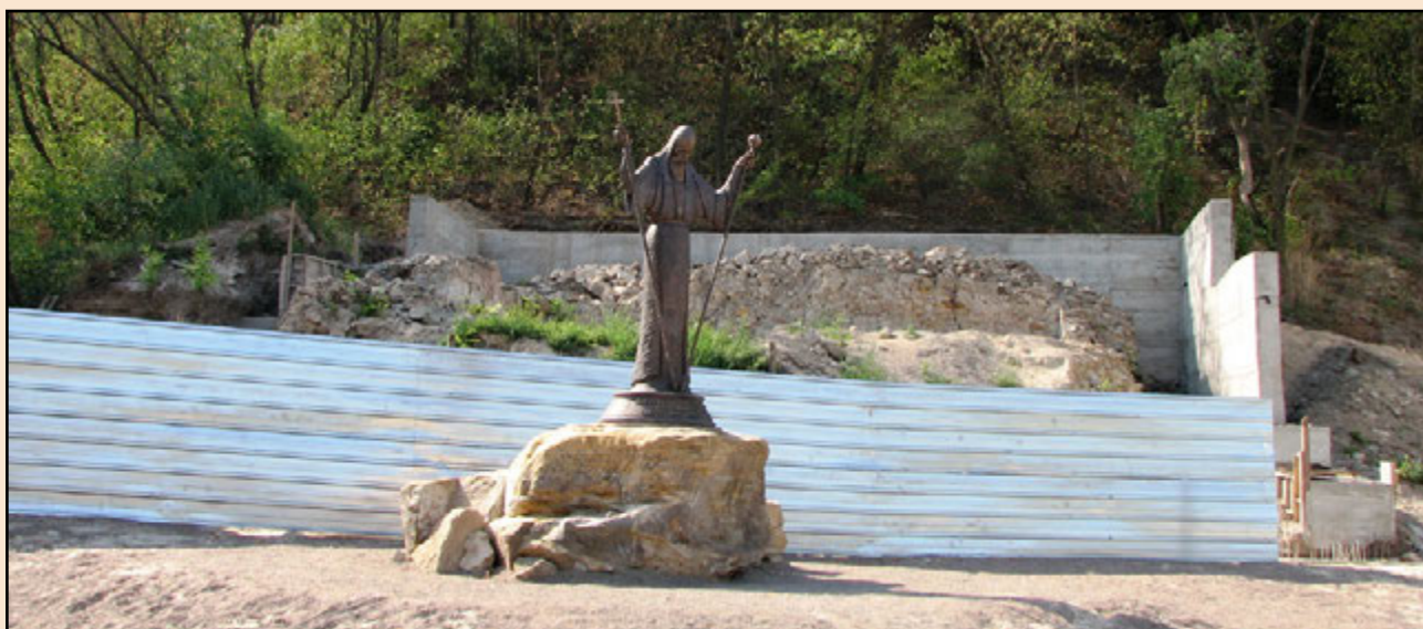
Іл. 5. Будівництво навколо фундаментів. 2007 р.

на фото (іл. 5) помітно зупинку будівництва, тоді як автентичні фундаменти вже розсипаються та заростають рослинами – втрачають статус in situ (іл. 6). На фото 2013 року (іл. 7) бетонних споруд стін не стало більше, а над муром XVII ст. з'явився залізний дах, який підтримує сумнівна дерев'яна стовпова конструкція, вкопана по обидва боки фундаменту