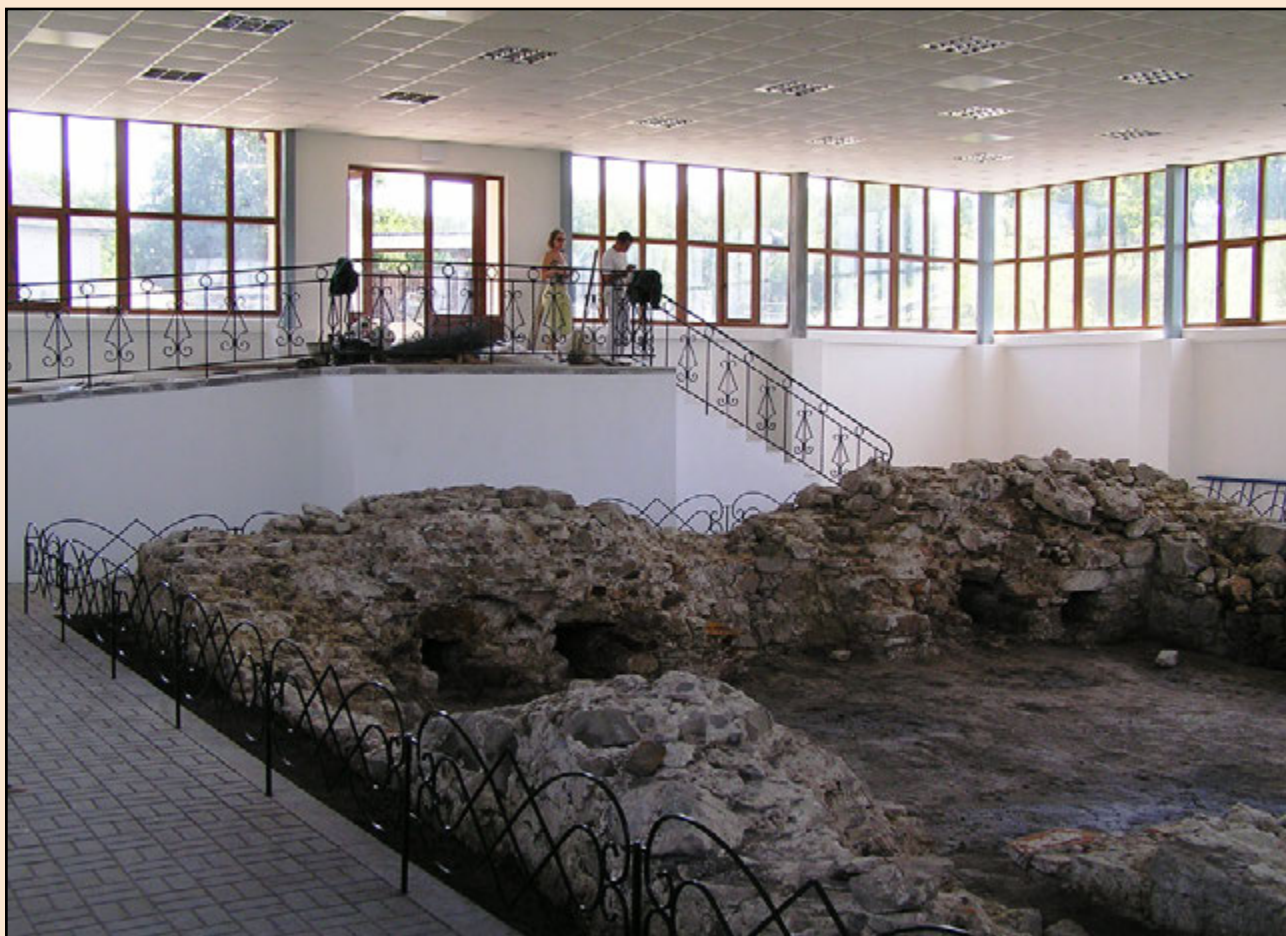
Іл. 4. Павільйон у с. Суботів.

на фото (іл. 5) помітно зупинку будівництва, тоді як автентичні фундаменти вже розсипаються та заростають рослинами – втрачають статус in situ (іл. 6). На фото 2013 року (іл. 7) бетонних споруд стін не стало більше, а над муром XVII ст. з'явився залізний дах, який підтримує сумнівна дерев'яна стовпова конструкція, вкопана по обидва боки фундаменту