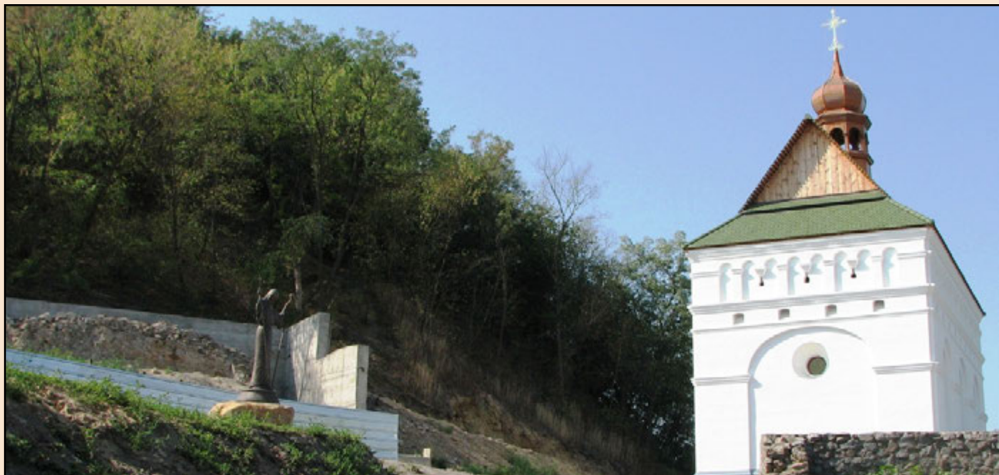
Іл. 2. Фундаменти XVII ст. та новозбудована церква Петра і Павла.

Хоча церква функціонувала протягом кількох десятків років і наразі є одношаровим закритим археологічним комплексом (без перебудов та руйнувань масштабів Десятинної), проте залишки її фундаментів мають багато спільного із залишками першої мурованої святині Київської Русі, як-то: муровані фундаменти, рештки додаткових цегляних конструкцій (піч), будівельні залишки прибудов, порушення конструкцій унаслідок руйнування (1240 р. в одному випадку та 1678 р. в іншому). Тому, враховуючи висновки В. Козюби про необхідність детально проробити всі питання, пов'язані з реставрацією, консервацією та умовами експонування об'єктів Десятинної церкви, приклад чигиринської пам'ятки стане у нагоді [5, с. 36].