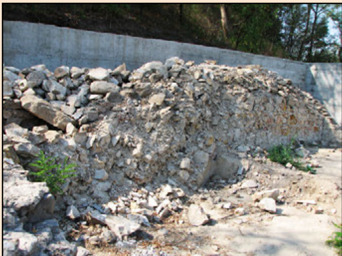
Іл. 6. Стан фундаментів. 2007 р.

в культурний шар та материк. Основна причина зупинки робіт – брак фінансування.