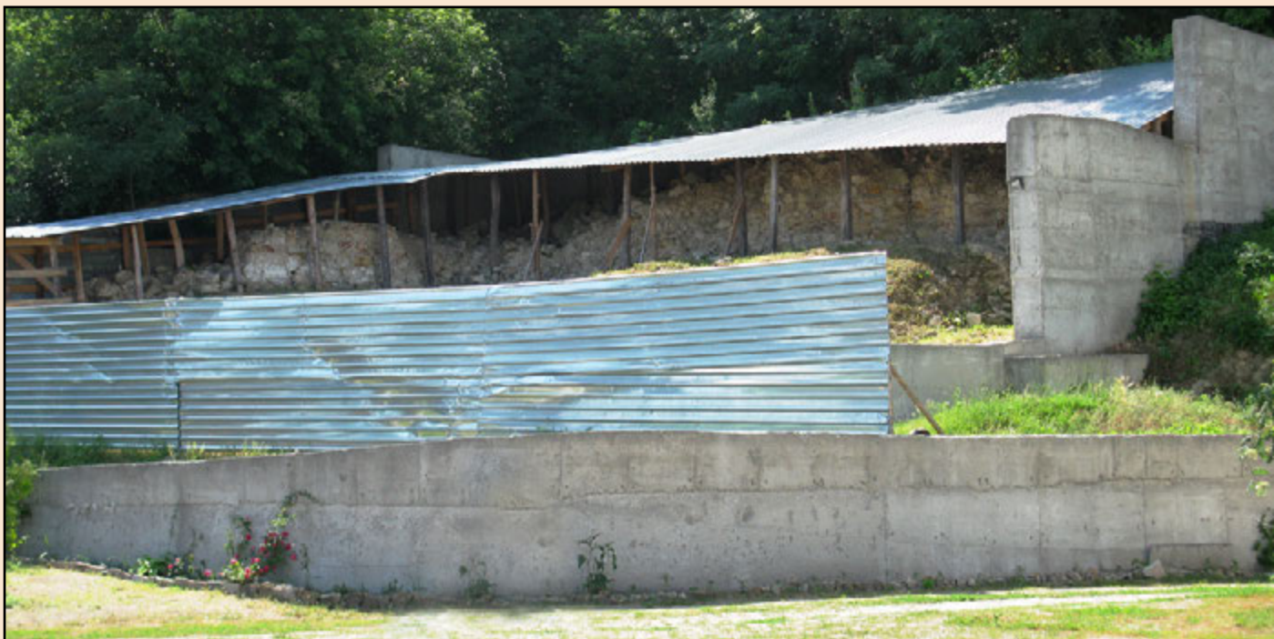
Іл. 7. Будівництво навколо фундаментів. 2013 р.

Отже, археологічне дослідження залишків церкви Петра і Павла в Чигирині XVII ст. було проведене з розрахунком на подальшу реконструкцію храму та музеєфікацію автентичних фундаментів. Утім, тоді, як нова святиня давно приймає відвідувачів, поруч майже десять років руйнуються давні підмурки і новий «павільйон». Доля пам'ятки розкриває досвід, у якому є як позитивна сторінка, так і сумна.