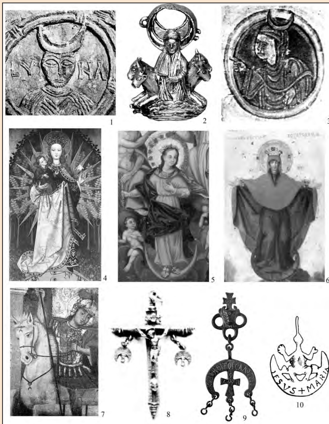
Пл. 2. Зображення півмісяця та підвіски-лунниці у християнській іконографії та культовій пластиці:

1 – фрагмент барельєфу з каплиці Санта-Марія, відома як Квінтанілла де лас Вінас, пров. Бургос, Іспанія, VII–VIII ст.; 2 – долина Маас, Франція, друга половина XII ст.; 3 – фрагмент мініатюри Каталонського манускрипту, Іспанія, XII ст.; 4 – Мадонна, одягнена в сонце (польський майстер), середина XV ст.; 5 – з ікони «Коронування Богородиці», Городне Волинської обл., середина XVIII ст.; 6 – з ікони «Покрова Богородиці», Дорогиничі Волинської обл., перша половина XVIII ст.; 7 – з ікони «Юрій Змієборець», Волинь, XVII ст.; 8, 10 – Іспанія, XIX ст.; 9 – Мала Азія, VIII–IX ст.