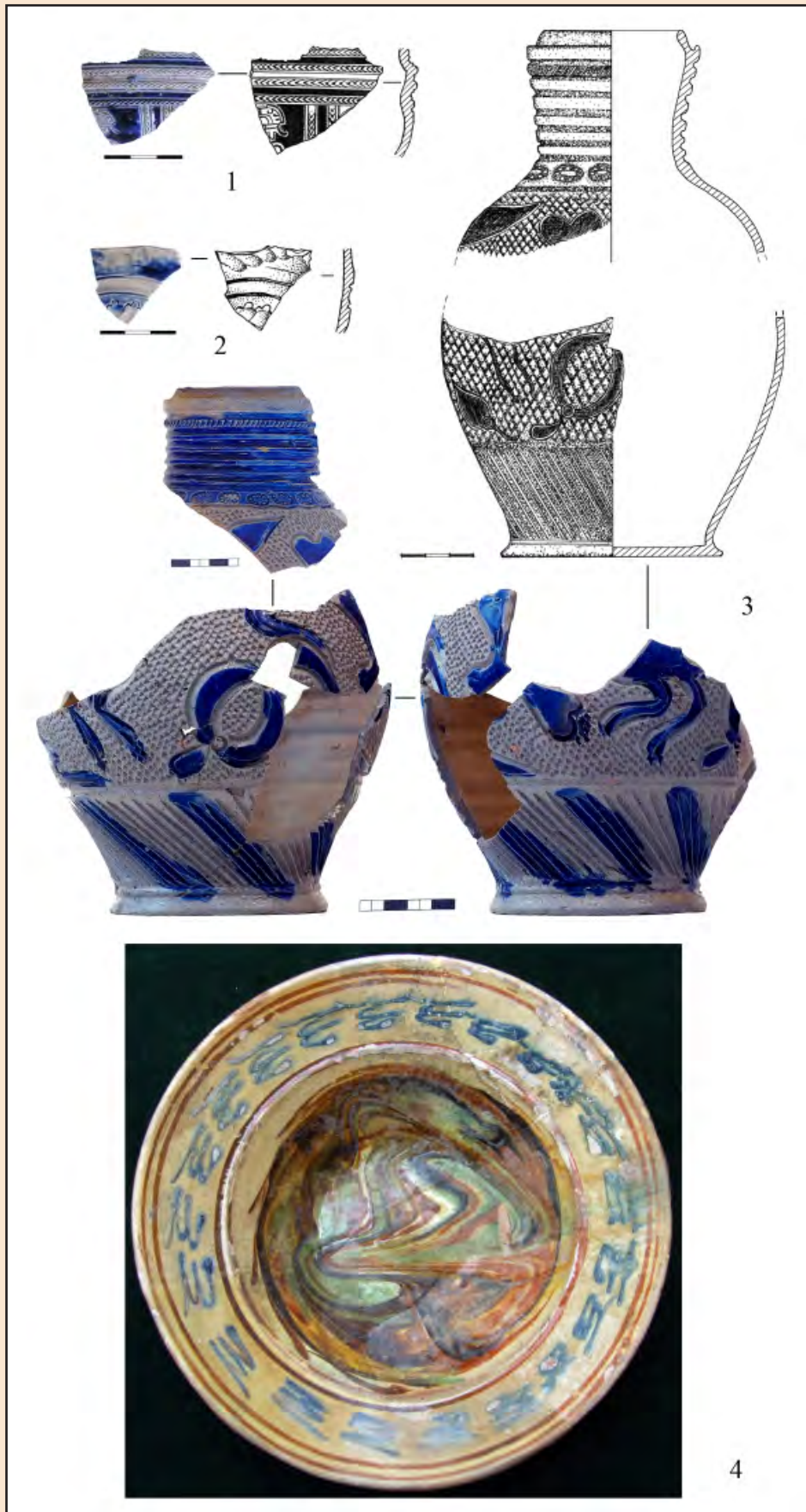
Іл. 2. Західноєвропейський імпорт: 1-3 – кам'яна маса, 4 – кераміка