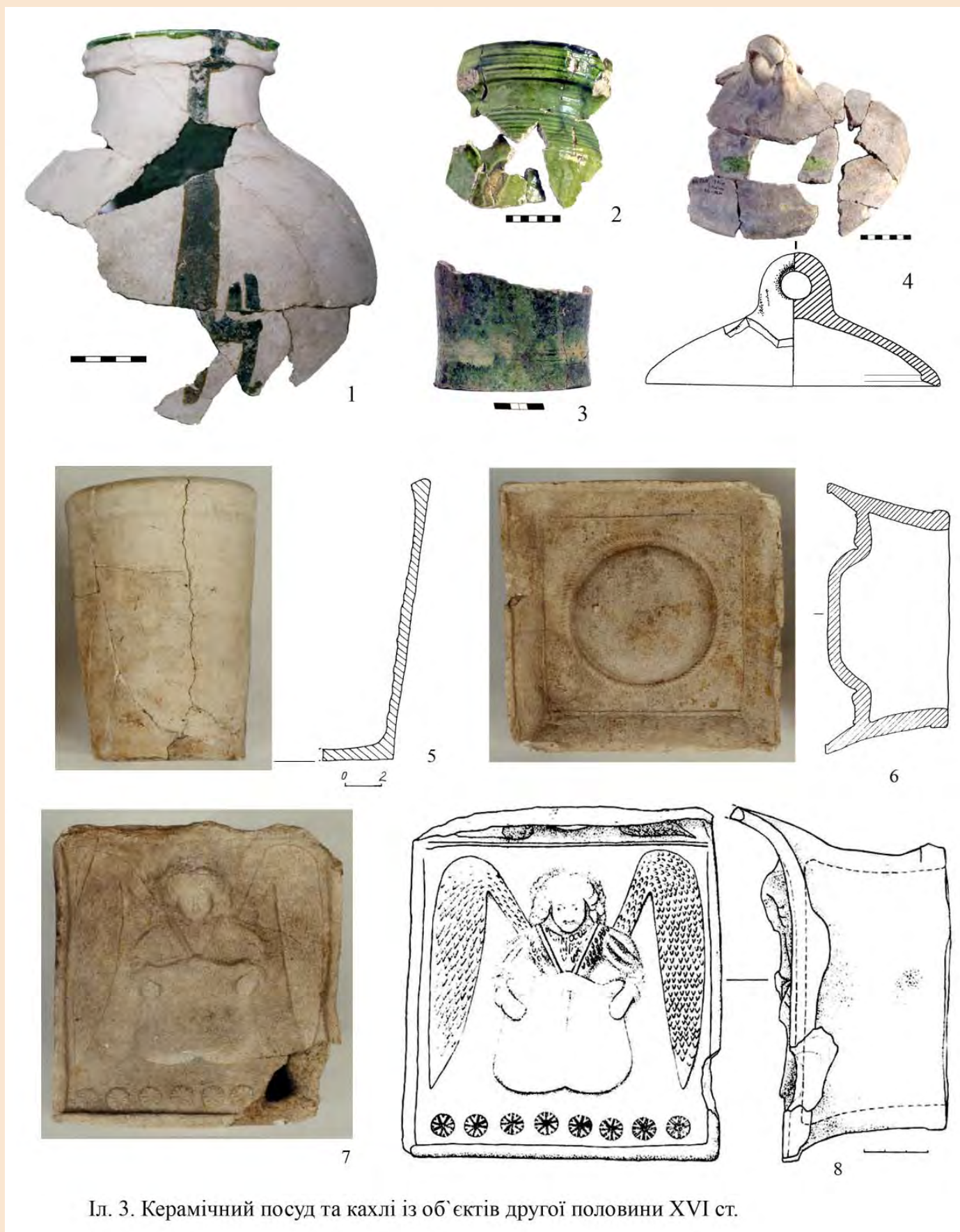
Іл. 3. Керамічний посуд та кахлі із об'єктів другої половини XVI ст.