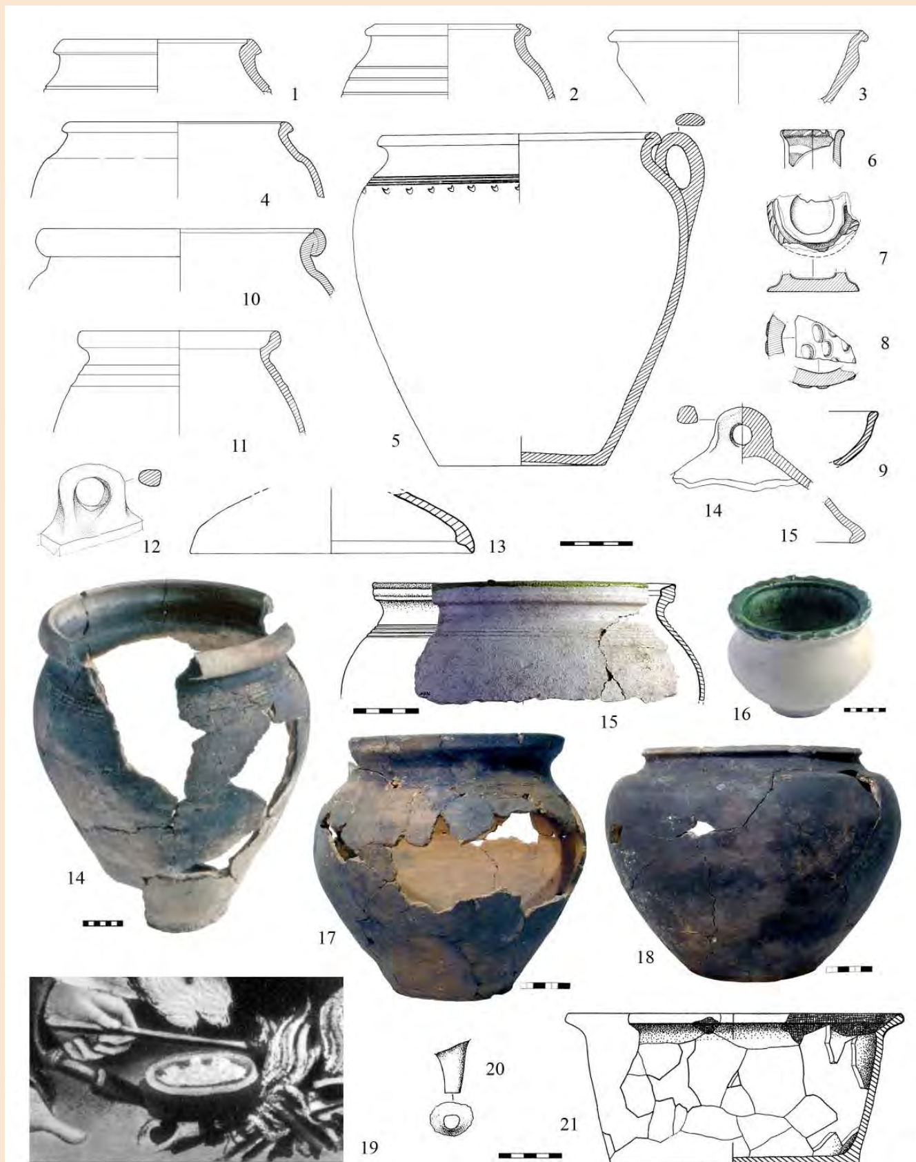
Іл. 2. Керамічний посуд другої половини XIII - XIV (1-4), XV (5-14) та другої половини XVI ст. Зображення ринки у чеських стародруках XV ст. (19).