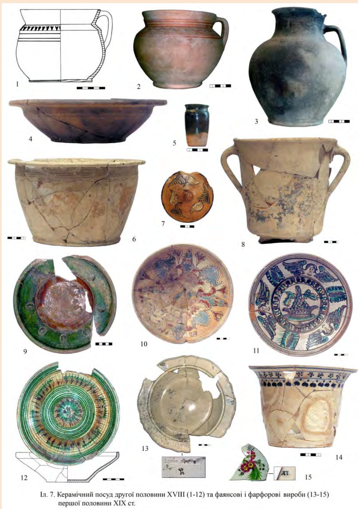
Пл. 7. Керамічний посуд другої половини XVIII (1-12) та фаянсові і фарфорові вироби (13-15) першої половини XIX ст.

Знаємо стільки, скільки пам'ятаємо Знаєм стільки, скільки помним Tantum scimus, quantum memoria tenemus