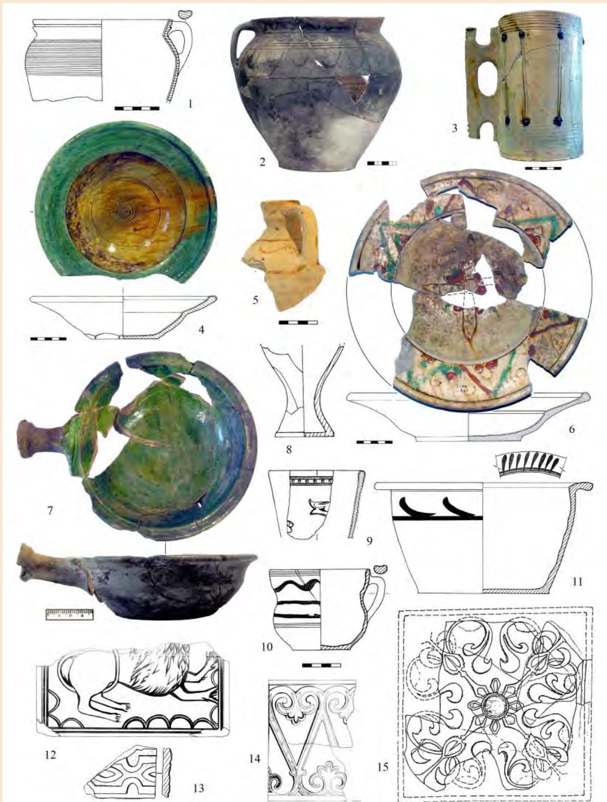
Іл. 4. Посуд та кахлі із об'єктів XVII ст.