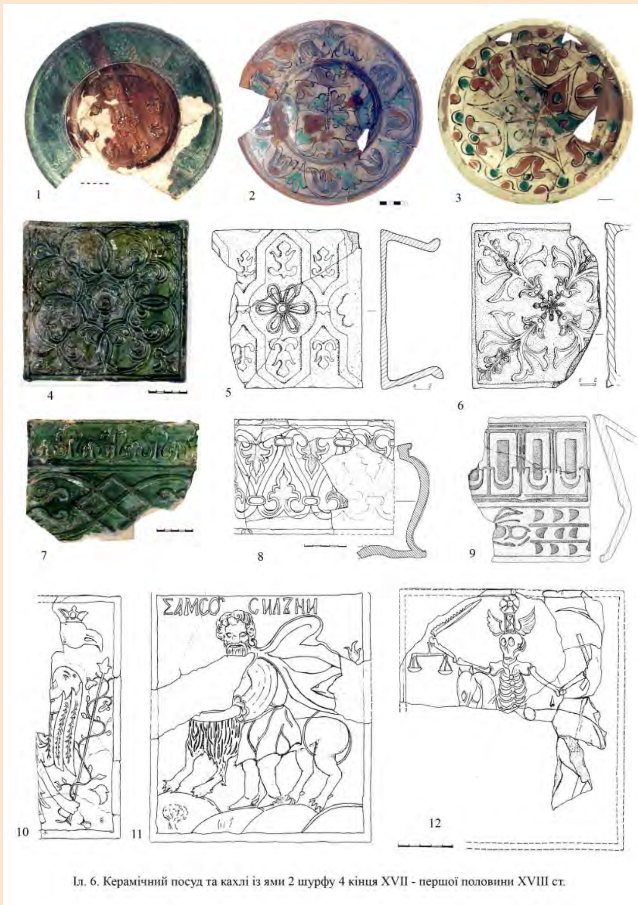
Іл. 6. Керамічний посуд та кахлі із ями 2 шурфу 4 кінця XVII - першої половини XVIII ст.

Знаємо стільки, скільки пам'ятаємо Знаем столько, сколько помним Tantum scimus, quantum memoria tenemus