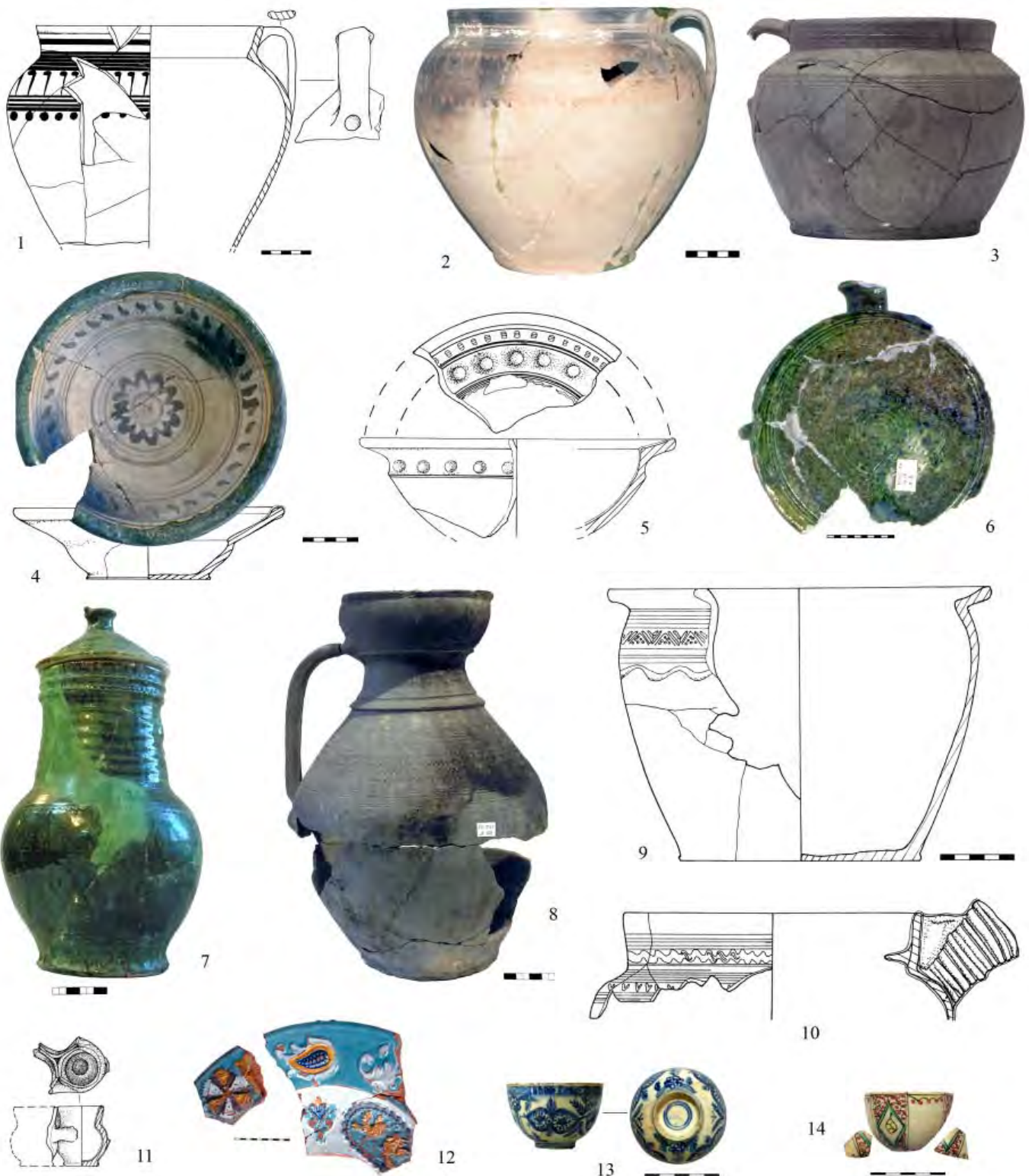
Іл. 5. Керамічний посуд другої половини XVII (1, 4-6, 11) та кінця XVII - першої половини XVIII ст.

Знаємо стільки, скільки пам'ятаємо Знаєм стільки, скільки помним Tantum scimus, quantum memoria tenemus