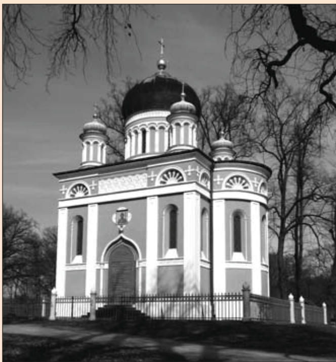
Церква св. Олександра Невського у Потсдамі кінця XIX ст. Архіт. В. Стасов