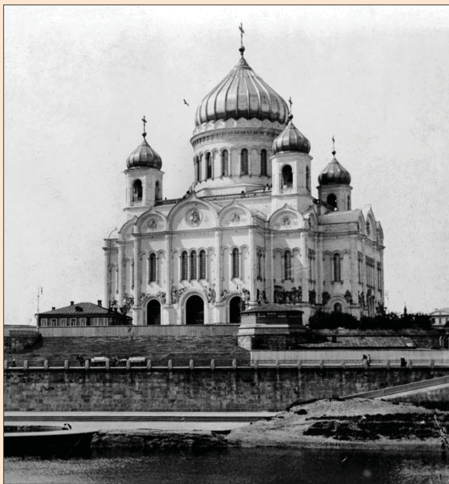
Храм Христа Спасителя в Москві. Архіт. К. Тон. Фото кінця XIX ст.

Потсдамі (передмістя Берліну, 1826 р.), а другу в Києві (Десятинна, 1828 р.). Десятинну ми втратили, церква в Потсдамі збереглася, і разом з іншими будівлями колонії ввійшла до списку Всесвітньої спадщини ЮНЕСКО (1999 р.).