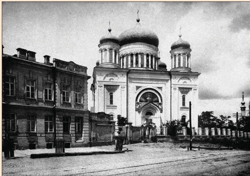
Нова Десятинна церква архітектора В. Стасова. Фото кінця XIX ст.

ня споруди, зруйнованої 1240 року, неможливе через незворотну втрату достовірних даних. Та, навіть коли б такі дані й були, треба було б зневажити вісім століть київської історії, протягом яких місто існувало без Десятинної церкви. До того ж громадськість ще не встигла оговтатися від таких квазінаукових монстрів, як Золоті ворота, Пирогоща, або ж Воскресенська церква у Переяславі.