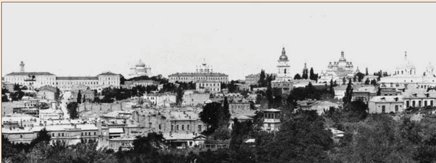
Нова Десятинна церква в панорамі Старого міста. Фото кінця XIX ст.

помітити, що подрібнений неовізантійський п'ятиверх із цибулястими банями значно відрізняється від первісного задуму. Та, дякуючи нашим корифеям реставраційної науки, ми маємо щасливий вибір: відбудувувати або «як було», або «як було задумано».