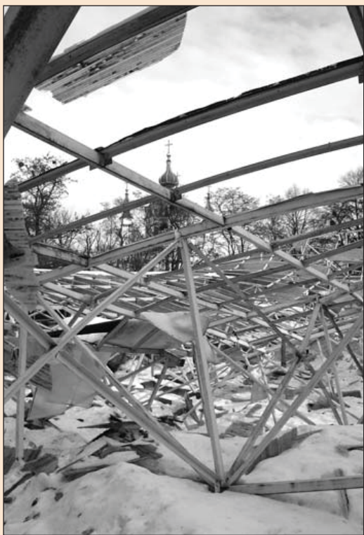
Руїни захисного покриття розкопок Десятинної церкви. Фото 2010 р.

собор у Києві. Москвофільство, помножене на синодальний клерикалізм, виробило той потворний варіант стилю, який прийнято називати «епархіальним». Але ці зміни стилю, як і розмноження його вторинних екземплярів, відбувалися вже значно пізніше, переважно після смерті Василя Стасова (†1848 р.).