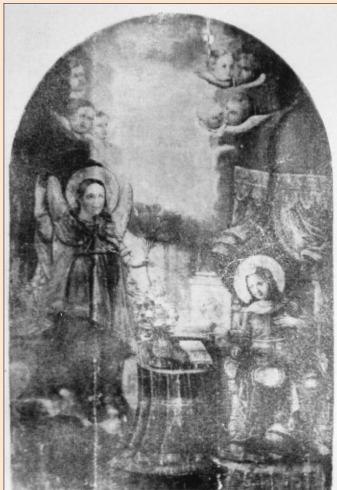
Ил. 4. Икона «Благовещение» из Воскресенской церкви. с. Андреевка (сейчас - Балаклейского р-на Харьковской обл.)