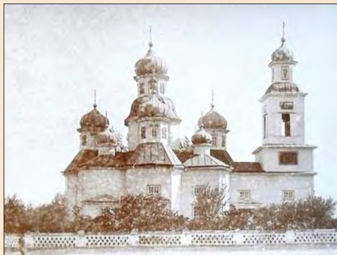
Ил. 3. Храм Воскресения Христова. с. Андреевка (сейчас - Балаклейского р-на Харьковской обл.). Фото Е. Редина 1902 г.

Как и в случае с храмом Рождества Богородицы, постройку храма Воскресения Христова (ил. 3), за архиепископом Филаретом, следует отнести не позже, нежели к 1666 году. В этом случае владыка исходит из того, что в 1728 году был построен новый деревянный Воскресенский храм, а в имеющемся в нем Евангелии указывается, что он был не первый [3, с. 146]. Однако новому храму не суждено было долго служить, так как уже в 1742 году он сгорел. Причину возгорания мы, к сожалению, не знаем. Однако в этом же году был построен новый деревянный храм. В 1781 году храм снова возобновили. Но уже в 1796 году было решено перестроить храм Воскресения Христова. Решение свелось к тому, что его хотели перенести на новое место и поставить на каменный фундамент. В 1880 году новый перестроенный и перенесенный храм был готов. Но во время грозы, перед освящением, сей храм до освящения сгорел. Местные жители увидели