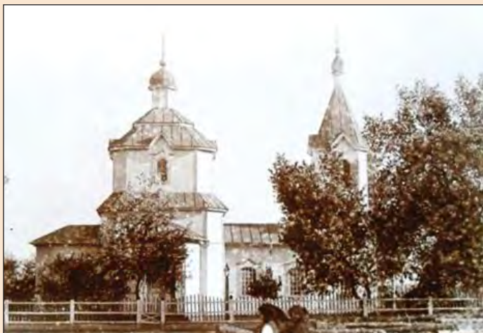
Ил. 2. Храм Рождества Богородицы. с. Андреевка (сейчас - Балаклейского р-на Харьковской обл.)