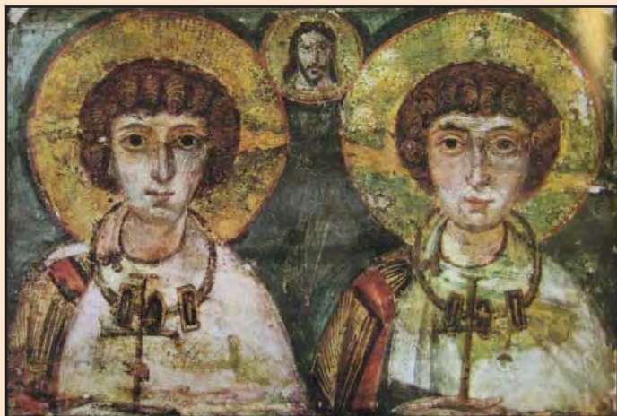
Святі Сергій та Вакх

матір з немовлям» і «Мученик та мучениця» – найбільш давні з усіх відомих християнських ікон, які збереглися до наших днів. Вони були створені задовго до розділення церков, тому їх духовний зміст є об'єднуючим для всього християнського світу. А оскільки доля решти колекції ікон архімандрита Порфирія, що залишалися в музеї Києво-Печерської лаври, невідома, ці експонати мають надзвичайну цінність для вивчення не лише візантійського живопису, а й діяльності самого Порфирія Успенського.