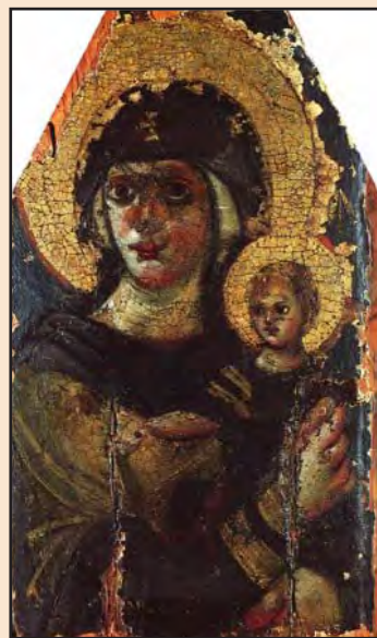
Богоматір з немовлям