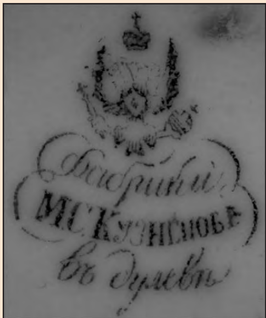
Ил. 1. Клеймо на чашке фабрики М.С. Кузнецова в Дулеве

ное клеймо – двуглавый орел с надписью в три строчки: «фабрики М.С. Кузнецова в Дулеве» (ил. 1). Такой тип клейма наносился на изделия завода в 1854–1864 годах.