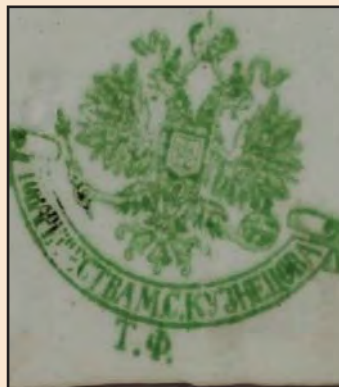
Ил. 7. Клейма Тверской фабрики «Т-ва М.С. Кузнецова»