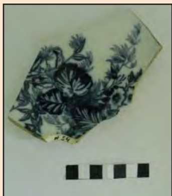
Ил. 8. Фрагмент фаянсовой тарелки, изготовленной в Будах «Т-ва М.С. Кузнецова»