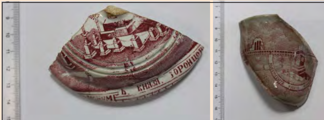
Ил. 14. Фрагменты посуды с архитектурно-топографической композицией

На фрагменте фаянсовой тарелки сохранилась растительная ассиметричная, темно-синего цвета композиция, выполненная в технике печати. На обратной стороне – кобальтовое клеймо с изображением кленового листа, в середине которого – надпись «FLORE», под листком – «F. SUSSMANN». Также на доньшке находится клеймо «1 SUSSMANN», вдавленное в тесто (ил. 15).