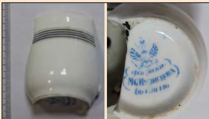
Ил. 2. Фрагмент чашки кофейной с клеймом, изготовленной на Рижском заводе «Т-ва М.С. Кузнецова»