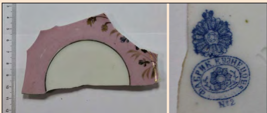
Ил. 13. Блюдец, изготовленное на фабрике И.Е. Кузнецова