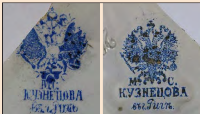
Ил. 5. Клейма Рижского завода «Т-ва М.С. Кузнецова»