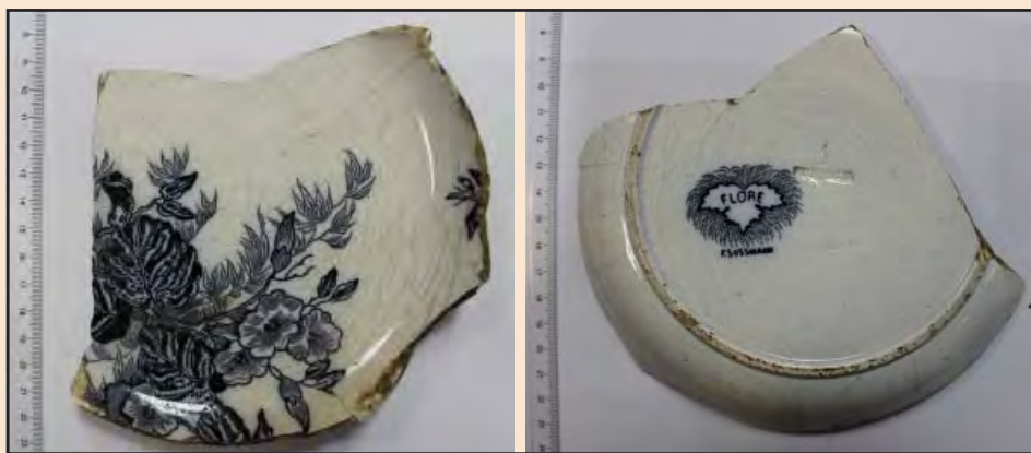
Ил. 15. Фрагмент фаянсовой тарелки, изготовленной на производстве А.Ф. Зуссмана

Фарфоровые изделия с фабрики Городница промаркированы разными клеймами. Все они выполнены в технике печати надглазурно. На одном фрагменте – монограмма, ниже надпись – «ЗУСМАНЪ», которая обрамлена рамкой с завитками. В рамке надпись – «ГОРОДНИЦА» (ил. 17).