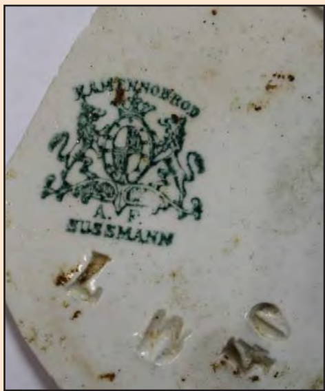
Ил. 16. Клеймо на изделии производства А.Ф. Зуссмана в Каменных Бродах

заводов Зуссмана датируются 80-ми годами XIX в. (1917).