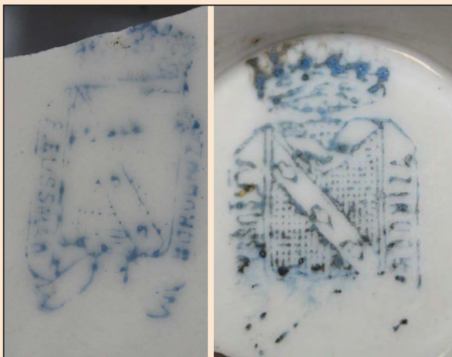
Ил. 19. Клейма на изделиях А.Ф. Зуссмана в Городнице

симо от уровня их доходов. Ассортимент коллекции доказывает разноплановость технологии производства фарфора и фаянса. Клейма изделий говорят об их датировке и широкой географии фарфоровых и фаянсовых предприятий в Российской империи.