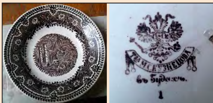
Ил. 10. Тарелка с архитектурно-городской композицией из Феодосийского музея древностей, изготовленная в Будах