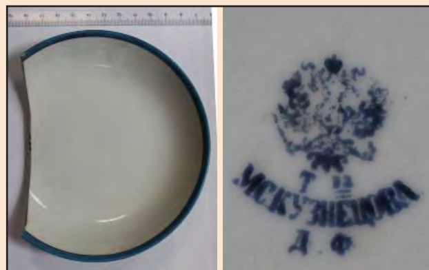
Ил. 11. Блюдец с клеймом Дмитровской фабрики «Т-ва М.С. Кузнецова»