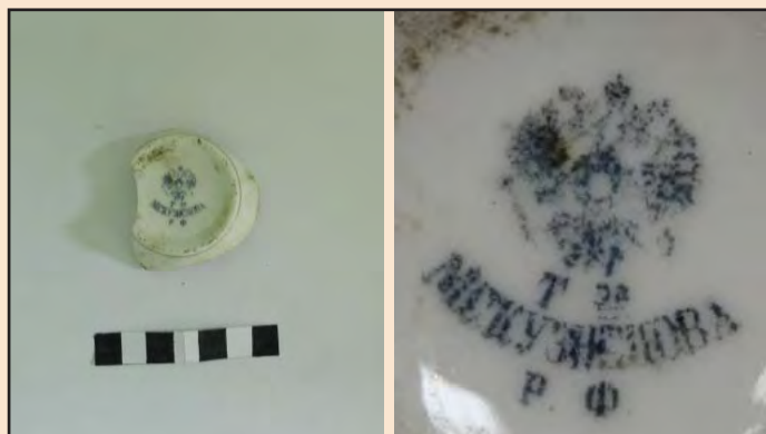
Ил. 3. Доньшко кофейной чашки с клеймом Рижского завода «Т-ва М.С. Кузнецова»