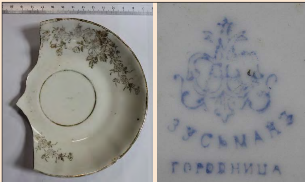
Ил. 18. Блюдце, изготовленное на производстве А.Ф. Зуссмана в Городнице

Еще один производитель представлен фрагментом фаянсового изделия (МІДЦ, НДФ, № 45) с клеймом завода Л. Чаманского (основан 1880 году в г. Влацлавске в Польше). На сохранившемся фрагменте – часть растительной композиции, расписанной тремя красками – голубой,