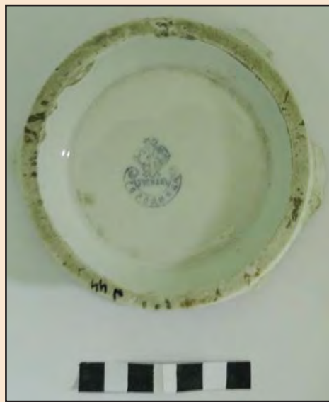
Ил. 17. Клеймо на изделии производства А.Ф. Зуссмана в Городнице