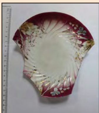
Ил. 12. Блюдец Дмитровской фабрики «Т-ва М.С. Кузнецова»