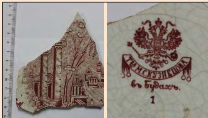
Ил. 9. Фрагмент тарелки с архитектурно-городской композицией, изготовленной в Будах «Т-ва М.С. Кузнецова»