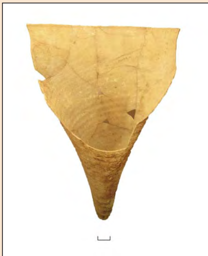
Іл. 1. Реставрована лампа.

але більш вірогідним дослідники вбачають їхнє використання як лампад, які вставляли у хорос [9, с. 102]. Одна з таких посудин реставрована (іл. 1). Цей тип посудин