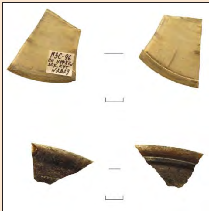
Іл. 4. Фрагменти віконниць.

імовірно, частина віконниці або вітражу [5, с. 201]. Загалом знайдено 5 екземплярів, які походять з об'єктів XII та кінця XII – середини XIII ст. Виготовлення віконниць відбувалося кількома способами: шляхом швидкого обертання відкритого конусу