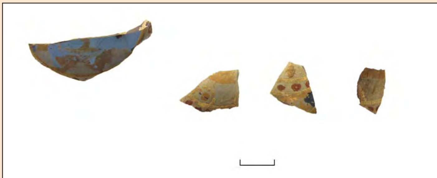
Іл. 2. Уламки посудини візантійського виробництва. Фото О. Журухіної

Браслети (табл. 1) складають найчисленнішу групу прикрас (87 екземплярів) і представлені різноманітними типами: круглі гладкі (виготовлені з круглого в перерізі скляного джгута), круглі перевиті (на гладкий джгут браслета накладалася смуга із жовтого непрозорого скла), кручені (виготовлявся з квадратного в перерізі джгута, який