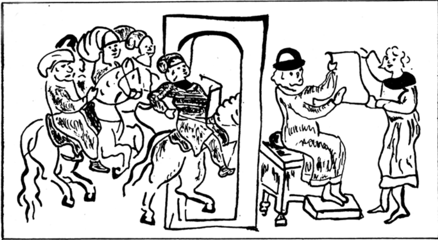
Рис. Війська Романа Мстиславича входять у місто через ворота.

В історіографії склалася традиція розмішувати їх у системі оборонних валів у районі Вознесенського або сусіднього з ним узвозу (сучасні вул. Смирнова-Ласточкина і Петровська). Однак літописний текст, як уявляється, дає можливість тлумачити його інакше. Стаття 1202 р. повідомляє: «ѣха на борзѣ со всѣми полкы къ Києву Романъ, и отвориша ему Кыяне ворота Подольская, въ Копыревѣ конци, и въеха въ Подолье, и посла на Гору къ Рюрикови и ко Ольговичем» 3 . Кияни відкрили Роману Мстиславичу ворота, через які князь увійшов на Поділ (рис. 2).