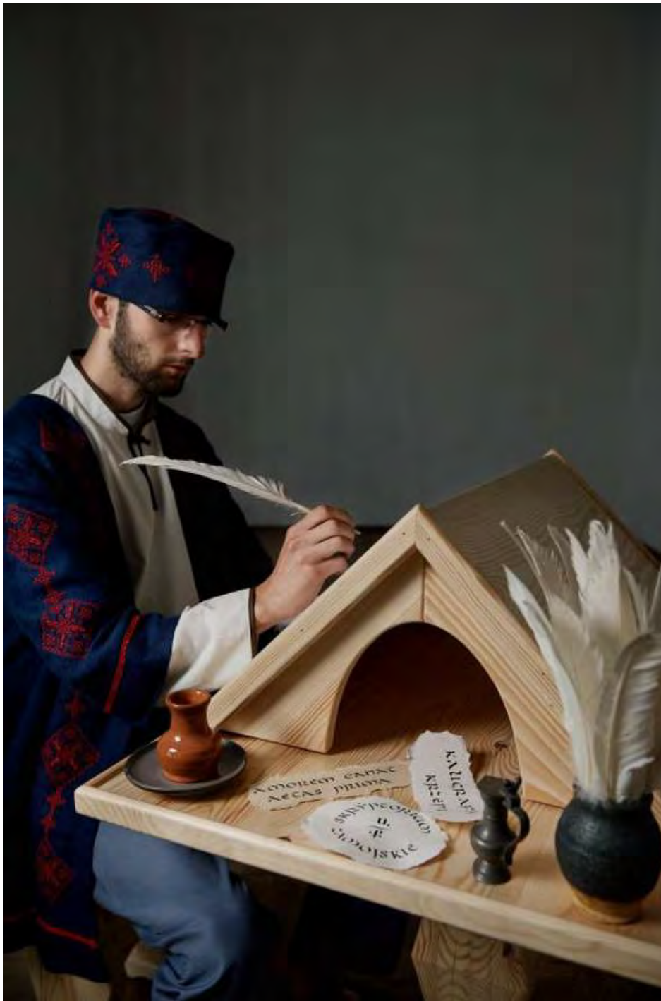
Электронный ресурс [Режим доступа: http://zci.zamosc.pl/dat/news/305b.jpg ]