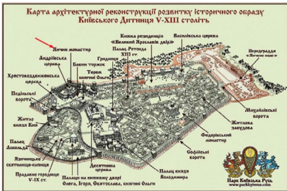
Іл. 2. Карта архітектурної реконструкції розвитку Київського Дитинця V–XIII ст.