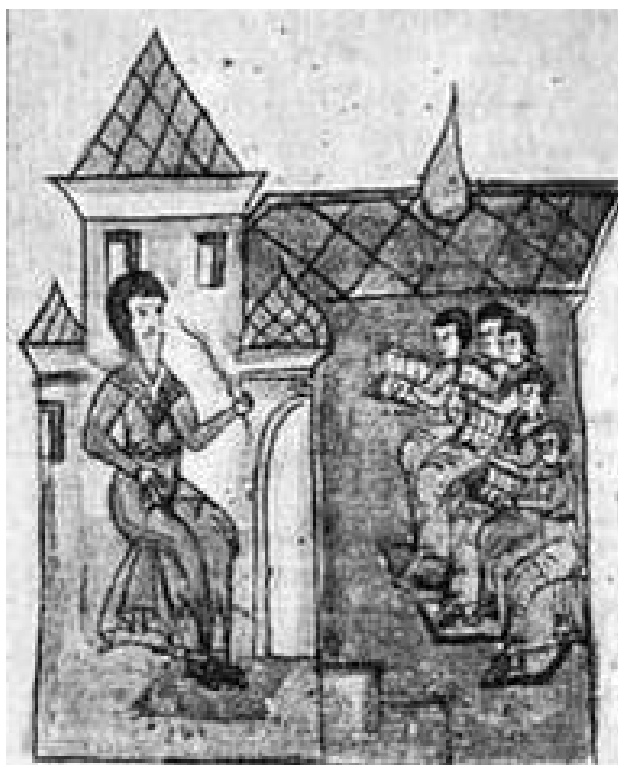
Іл.3. Школа при Янчиному монастирі.