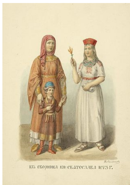
Іл. 5. Давньоруський княжий одяг.