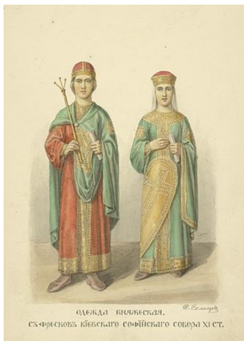
Іл. 4. Давньоруський одяг.