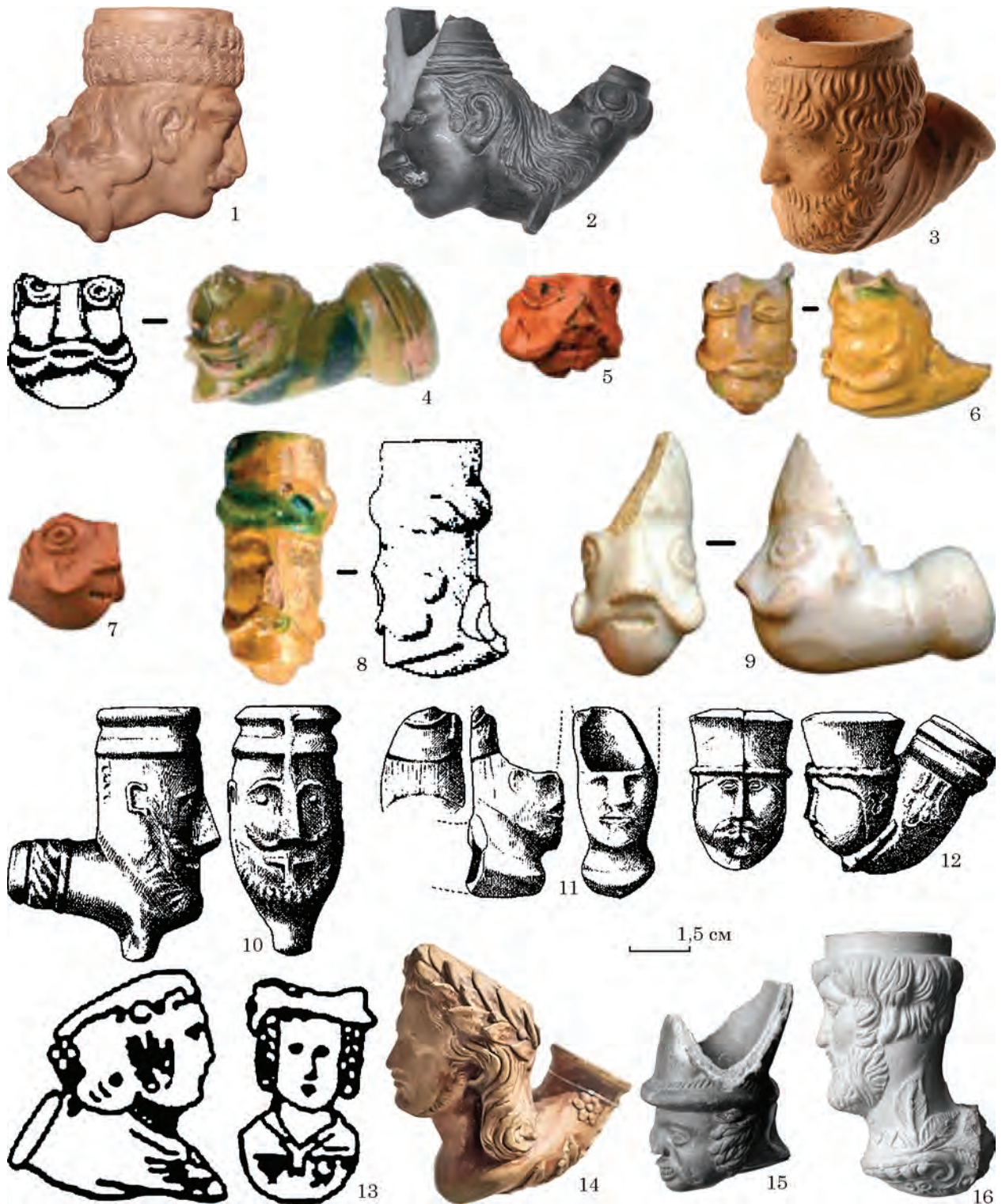
Рис. 2. Керамічні люльки із зображенням голови людини: 1 — Краків, археологічний музей; 2 — Чеські Будейовиці, кінець XVIII — початок XIX ст.; 3 — зображення Улісса С. Гранта, президента Сполучених Штатів (1869—1877 рр.), вироблена в м. Гроссальмероде (Німеччина, земля Гессен); 4 — східноєвропейське виробництво, Прага, Нове Місто, XVIII ст.; 5 — Прага, Нове Місто, XVIII ст.; 6 — Прага, Нове Місто, XVIII ст.; 7 — Прага, Нове Місто, XVIII ст.; 8 — можливо вироблена в Сілезії, Прага, Старе Місто, XVIII ст.; 9 — Празький град, XVIII ст.; 10 — виготовлено в м. Кюджа (Італія), музей м. Ровінь (Св. Катерина), Хорватія, 1750—1850 рр.; 11 — виготовлено в м. Кюджа (Італія), музей м. Ровінь, Хорватія, 1650—1750 рр.; 12 — виготовлено в Зелово (Сінь), знайдено у м. Тріль, Гардун, Хорватія, XVIII ст.; 13 — Москва, середина — друга половина XVIII ст.; 14 — історичний музей Державного Корсунь-Шевченківського історико-культурного заповідника, XIX ст.; 15 — «голова військового, Наполеон» (?), західноєвропейське виробництво, Празький град, XVIII ст.; 16 — «філософ», західноєвропейське виробництво, Празький град, XVIII ст.