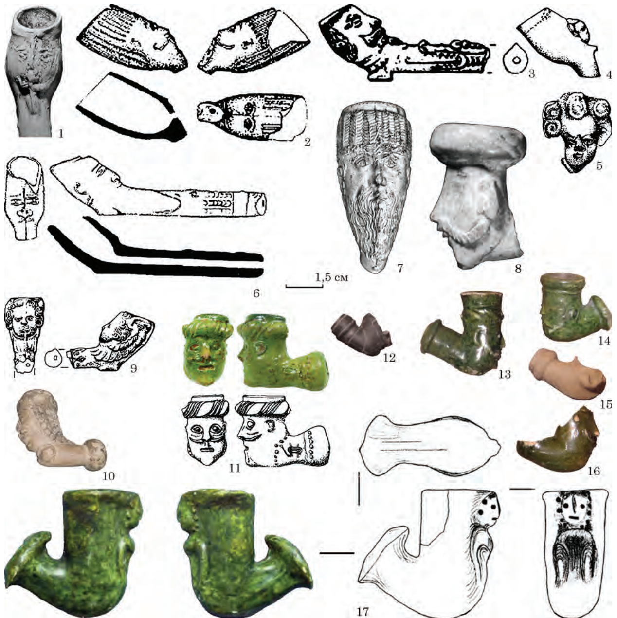
Рис. 1. Керамічні люльки із зображенням голови людини або обличчя: 1 — люлька північно-західного типу з обличчям чоловіка. XVII ст. (Holčík 1984, s. 90, далі посилення на джерело див. у тексті); 2 — Гданськ, XVII ст.; 3 — сюжет «крокодил ковтає чоловіка», Регенесбург, Баварія, Німеччина, 1640—1670 рр.; 4, 5 — зображення путті, Прага, друга половина XVII ст.; 6 — Гданськ, 30-ті рр. XVII ст.; 7 — Зборовське, Верхня Сілезія, друга половина XVIII ст.; 8 — Варшава, друга половина XVII ст.; 9 — люлька північно-західного типу із зображенням путті, Амберг, Баварія, Німеччина, середина XVII ст.; 10 — Перемишль, Музей Перемиської землі; 11 — Брно, остання третина XVII ст.; 12—17 — Краків, археологічний музей

теж були майстерні з виробництва люльок (наприклад, з 1628 р. у Кельні). Прикладом можуть бути люльки, знайдені в Гданську, де найстарші знахідки датовані 30-ми роками XVII ст. (рис. 1: 2, 6; Daňal 2013, s. 203, 215—216). Популярним сюжетом було зображення голови чоловіка з бородою і вусами, якого ковтає крокодил, ілюстрація анекдоту про Волтера Релі (Walter Raleigh) — англійського державного діяча, мореплавця і поета. Рельєфне зображення тварини знаходилося на мундштуку (рис. 1: 3, 6; Daňal 2013,