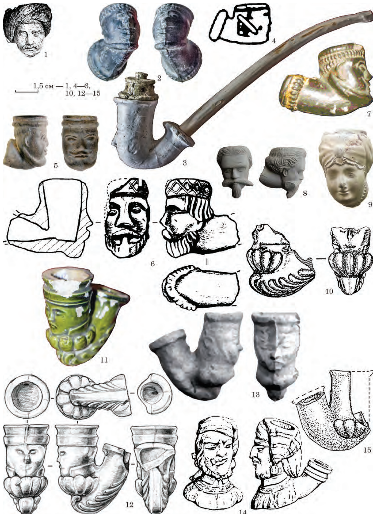
Рис. 3. Керамічні люльки XVIII—XIX ст. із зображенням голови людини або обличчя: 1 — Київ, вул. Олександрівська, 41; 2, 3 — музей Державного історико-культурного заповідника, Острог; 4 — Москва, XVIII ст.; 5 — Маріуполь, середина XVIII ст.; 6 — Миропілля, Сумська обл.; 7 — Дединово, Московська обл., початок XVIII ст. 8 — люлька з клеймом «...HONIG W... / ... SNEMNITZ», знайдено в Дубровнику, Кула Горні, Хорватія, вироблена у Банській Штявниці, Словаччина, початок XIX ст.; 9 — р-н Кам'янської січі, Херсонський обласний краєзнавчий музей, XVIII ст. 10 — Київ, ур. Гончарі-Кожум'яки, XVIII ст. 11 — музей Державного історико-культурного заповідника, Дубно, XVIII ст.; 12 — Хмільник, XVIII—XIX ст.; 13 — Острог, XVIII—XIX ст. 14 — «моряк з люлькою», вироблено Blanc Garin у м. Живе (Givet), знайдено на о-ві Помег, Фріульські о-ви, Марсель, Франція; 15 — Київ, ур. Гончарі-Кожум'яки, вул. Воздвиженська, 50, XVIII ст.