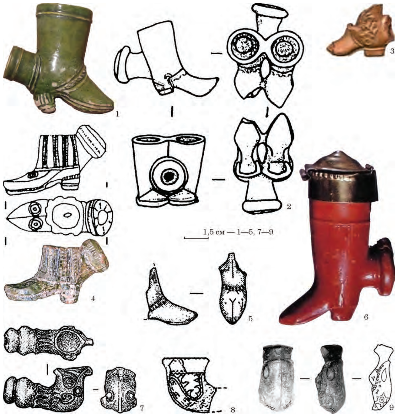
Рис. 5. Керамічні люльки із зображенням чобіт і люльки із зооморфними елементами: 1 — археологічний музей в Кракові; 2 — Київ, ур. Гончарі-Кожум'яки, вул. Воздвиженська, 43, друга половина XVIII ст.; 3 — Прага, р-н Na Poříčí, XVIII ст.; 4 — Батурин, цитадель, початок XVIII ст.; 5 — Київ, Печерськ, вул. Цитадельна, 3, початок XVIII ст.; 6 — виготовлена у м. Мартін, Словаччина, кінець XIX — початок XX ст.; 7 — Київ, вул. Цитадельна, 3, початок XVIII ст.; 8 — Бучак, Черкаська обл., кінець XVII — початок XVIII ст.; 9 — Михайлівський Золотоверхий монастир, Київ, кінець XVII — XVIII ст.

2020, с. 99—100). Усі три описані люльки за пропорціями чашечки можна віднести до горщикоподібних. Найменший діаметр чашечки знаходиться у верхній її частині. Аналогією українським зооморфним люлькам є наведена вище знахідка з Хорватії (рис. 4: 5).