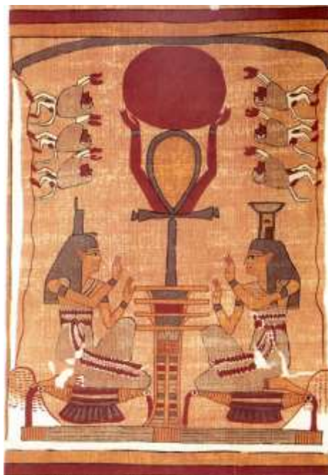
Іл. 6. «Книга мертвих» (близько 1450 року до н. е.). Британський музей

зображає анх, що підтримує висхідне Сонце. Фахівці підкреслюють дуже важливе значення давньоєгипетських малюнків, які не тільки були ілюстраціями до тексту, але й читалися майже так само, як і текст [Чегодаев 1994, с. 163]. Анх має форму хреста, який увінчується овальною петлею. Часто він зображується разом з різними божествами, які тримають його за петлю, звідки походить його інша назва – Сгх Ansata (лат. «хрест із ручкою»). Найбільш ранні зображення відносяться до періоду Раннього царства – близько 3000 року до н. е. [Fischer 1972, р. 13]. Достеменно походження цього символу невідомо, хоча було запропоновано чимало гіпотез. В ієрогліфічному письмі та в мистецтві анх використовувався для позначення поняття «життя». Також невідомо, який саме предмет спочатку представляв анх. У найдавніших версіях символу нижня смужка анха подана у вигляді двох окремих відрізків із гнучкого матеріалу, які, найімовірніше, відповідають двом кінцям вузла [Wilkinson 1992, р. 177]. Багато дослідників вважають, що це був вузол, утворений або із тканини, або з тростини, позбавлений будь-яких практичних цілей, який використовувався як амулет [Gordon, Schwabe 2004, р. 102–103].