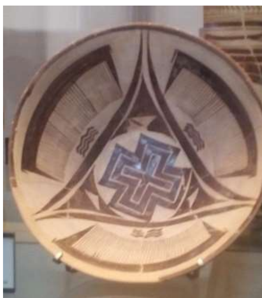
Гл. 2. Кераміка V тис. до н. е. із м. Сузи (південний захід сучасного Ірану) – одного з найдавніших міст світу, центру еламської цивілізації. Музей Лувру

На Стародавньому Близькому Сході, з його переважно астролатричним релігійним культом, сонячний хрест часто використовували в поєднанні з іншим солярним символом – крилатим диском. Серед дослідників основною версією (хоча і небеззаперечною) походження крилатого диска є образ Сонця в момент повного сонячного затемнення і, відповідно до цього, крила диска (іноді присутній і пташиний хвіст) – це сонячна корона, яка спостерігається при цьому астрономічному явищі [Todd 1894, р. 82]. На асирійських пам'ятках трапляються зображення крилатого диска з вписаним рівноконечним хрестом і верховним