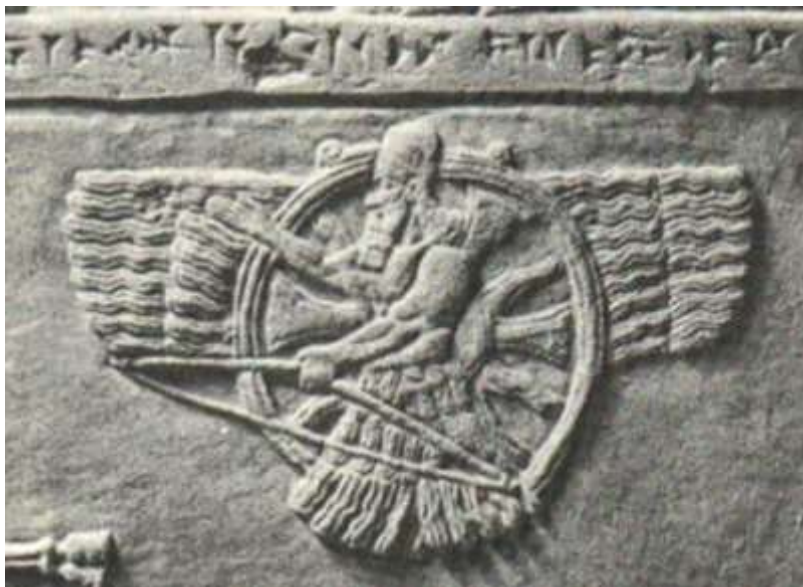
Іл. 4. Ассур (Ашшур) – бог війни й головне божество давніх ассирійців, уміщений у крилатий диск із хрестом (т. зв. «хрест Ассура»). Барельєф із царського палацу в Німруді IX ст. до н. е. Британський музей