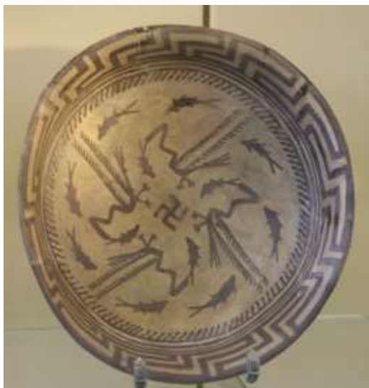
Лл. 12. Кераміка самарської культури. Центральне Межиріччя 6200–5700 рр. до н. е. Музей Передньої Азії, Берлін

З часів античності цей символ відомий як «гаммадіон», або «гамматичний хрест» (Cruz Gammata). Свастику також називали «тетрагаммадіон», оскільки символ може сприйматися, як складений з комбінації 4 грецьких букв «гамма» – \Gamma^9 , тетраскеліон (грец. «чотириногий») або у 3-х променевому виконанні – трискеліон (грец. «триногий»). Свого часу першовідкривач Трої Г. Шліман, який виявив безліч предметів із зображенням свастики, за роз'ясненнями з приводу знахідок звернувся до свого друга – відомого індолога ХІХ ст. Ф. М. Мюллера. Останній виступав проти ототожнення слова «свастика» із символом гаммадіона. Зокрема, він писав: «Я негативно ставлюся до використання слова Svastika поза межами Індії. Це слово індійського походження, і воно має в Індії свою історію і певне значення <...> Те, що такі хрести трапляються в різних частинах світу, може вказувати на їх спільне походження, а може й не вказувати на нього. Але якщо їх раз назвати “свастикою”, то vulgus profanum негайно перескочить до умовиводу, що всі вони походять з Індії, і чимало часу знадобиться, щоб викоринити цю оману» [Шліман].