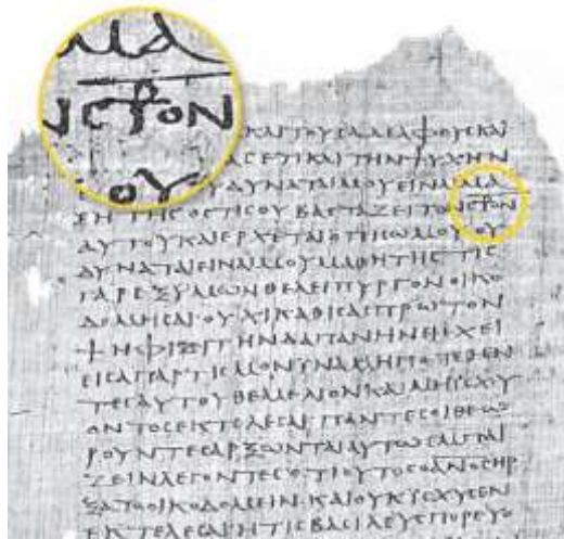
Іл. 10. Ставрограма на фрагменті грецького списку Нового Заповіту – папірусі Бодмера XIV-XV ст., який датується III ст. Бодмерська бібліотека, Женева