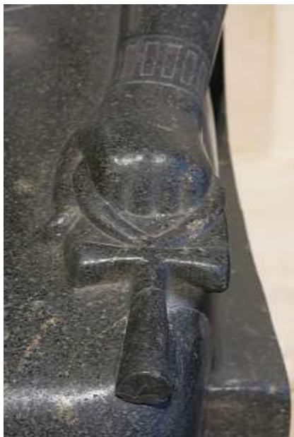
Іл. 7. Анх у руці богині Сехмет. 1393–1353 рр. до н. е. Музей Лувру

вмираючого та воскресаючого бога. Стовп Джед є давньоєгипетським образом біблійного Дерева Життя (один з варіантів образу Світового дерева (Arbor mundi)). Над стовпом Джед зображено знак життя – анх, який підтримує висхідне Сонце, що свідчить на користь солярної природи символу.