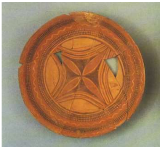
Гл. 1. Кераміка V тис. до н. е. халафської культури Північного Межиріччя. Метрополітен-музей, Нью-Йорк