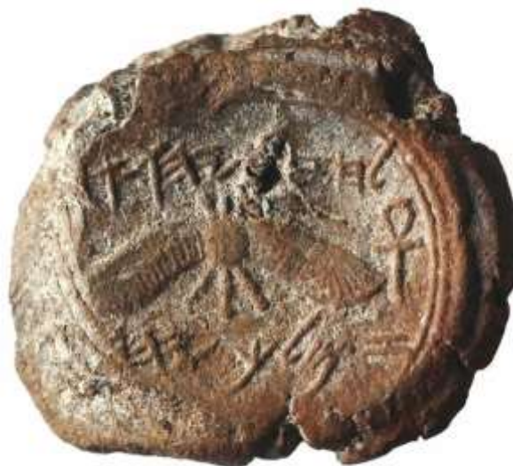
Іл. 8. Печатка іудейського царя Єзекії. Напис давнім єврейським шрифтом: «Належить Єзекії [синові] Ахаза, царю іудейському».

підтвердження й у знайдених археологічних пам'ятках). Поява єгипетської символіки на печатці іудейського царя може пояснюватися його союзницькими стосунками з Єгиптом [Eames].