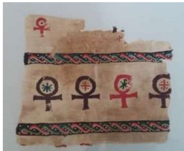
Іл. 11. Християнська рецепція Cruis Ansata на фрагменті тканини з гробниці в Ахмімі (Верхній Єгипет) IV-V ст. Музей Вікторії й Альберт, Лондон