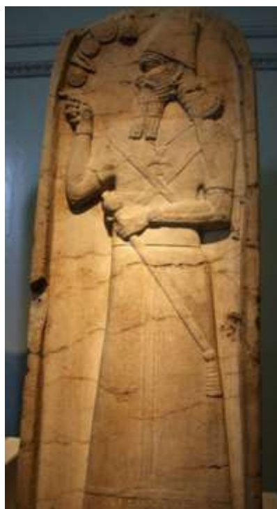
Іл. 5. Шамші-Адад V – цар Ассирії (близько 824 - 811 рр. до н. е.) 3 Барельєф із царського палацу у Німруді IX ст. до н. е. Британський музей

До солярної символіки переважна більшість дослідників схильна відносити відомий давньоєгипетський хрестоподібний символ анх (анкх). Відомий малюнок, з пам'ятки давньоєгипетської священної літератури т. зв. «Книги Мертвих», який