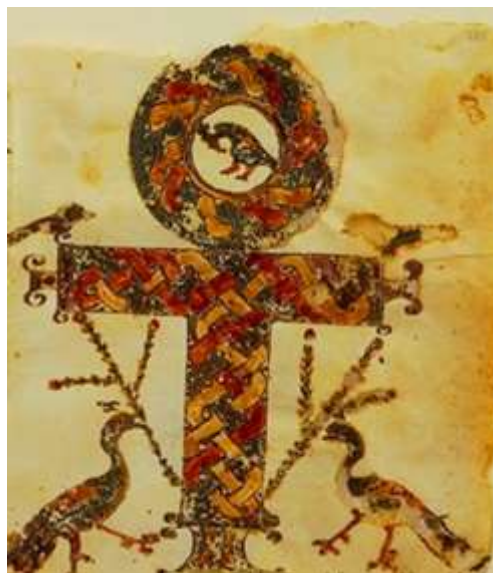
Іл. 11. Приклад християнської рецепції Cruis Ansata . Ілюстрація з Кодексу Глейзера. Старий музей, Берлін