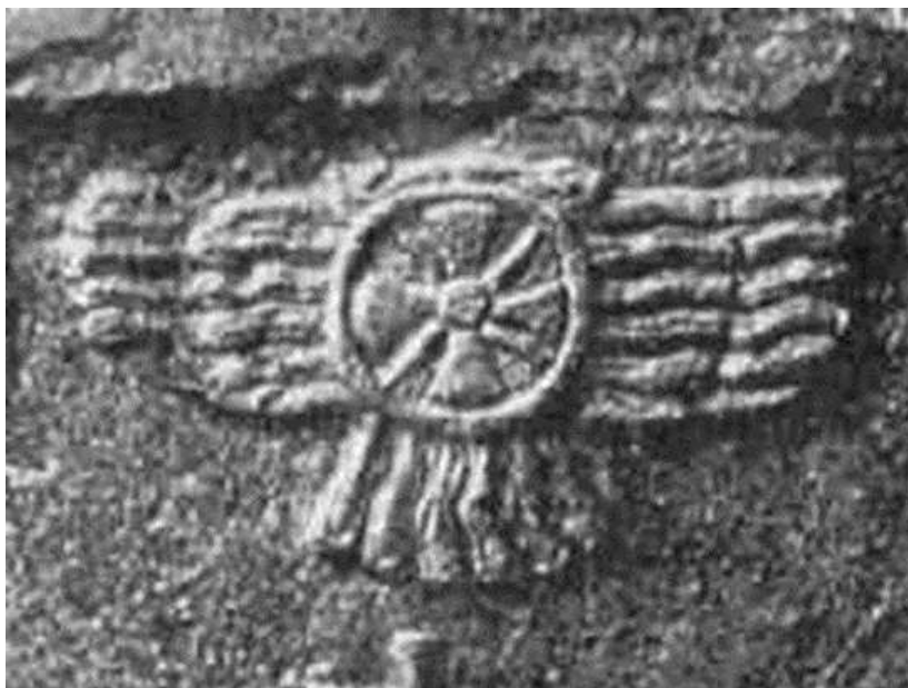
Іл. 3. Крилатий диск із вписаним сонячним хрестом. Барельєф із царського палацу в Німруді IX ст. до н. е. Британський музей

Утім, у даному випадку пояснення може бути досить простим і немає ніякого стосунку до християнства. Оскільки відомо, що цар Ассирії був одночасно й верховним жерцем Ассура, то це релігійний атрибут – знак благочестя [Топоров 2010, с. 289]. Відомо також, що цар Ассирії, подібно до єгипетського фараона, вважався втіленням свого бога. І, таким чином, хрест Ассура в правителя Ассирії, цілком ймовірно, мав й іншу функцію: використовувався як атрибут божества, як своєрідне «ототожнення» царя та племінного бога [Mackenzie 1915, р. 353].