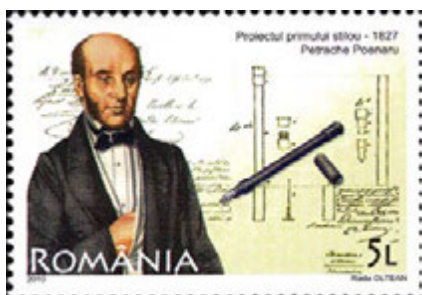
Петраке Поєнару та поштова марка, випущена в Румунії на честь винахідника авторучки

патент на «портативне перо з чорнилом». Ім'я Петраке Поєнару має бути в одному ряду не тільки з іменами Л. Уотермана та Д. Паркера, які вдосконалили авторучки, але й з найвідомішими винахідниками, яким людство зобов'язане появою електричної лампи, телефону, радіо тощо.