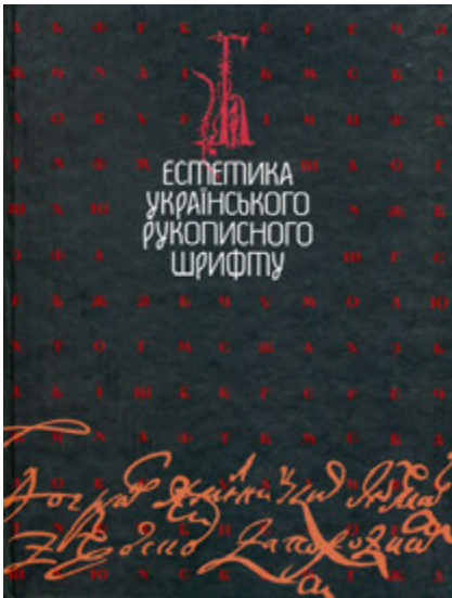
Обкладинка та сторінки книги В.