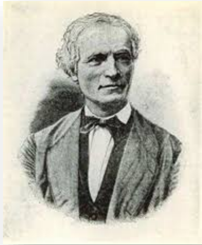
Жан Іполит Мішон

Не всі визнають графологію, вважаючи її псевдонаукою. Справді, багато тверджень графологів можуть здаватися перебільшеннями та викликати сумніви. Утім, ряд спостережень, зроблених ними, заслуговують на увагу. Крім того, зазначимо, що існує і почеркознавство – цілком науковий розділ криміналістики, що вивчає розвиток письмових навичок людини, розробляє методи дослідження почерку з метою вирішення завдань судово-почеркознавчої експертизи. Така експертиза ставить перед собою як ідентифікаційні завдання (встановлення виконавця рукопису і тотожності почерків), так і діагностичні (встановлення відомостей про особистість, яка написала текст). Тож почерк – річ серйозна.