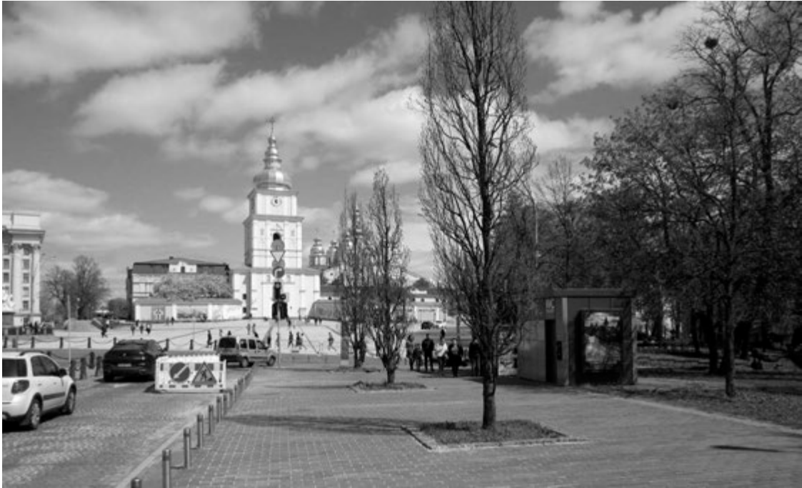
Іл. 3. Місце Покровської церкви. Фото 2021 року

У межах церковної садиби, на захід від церкви, були розташовані будівлі – ймовірно, помешкання причту, які також зображено на деяких планах міста. На південь від церкви, із зовнішнього боку огорожі садиби останньої, стояла криниця, яка обслуговувала як відвідувачів Покровської церкви, так і місцевих жителів (іл. 4).