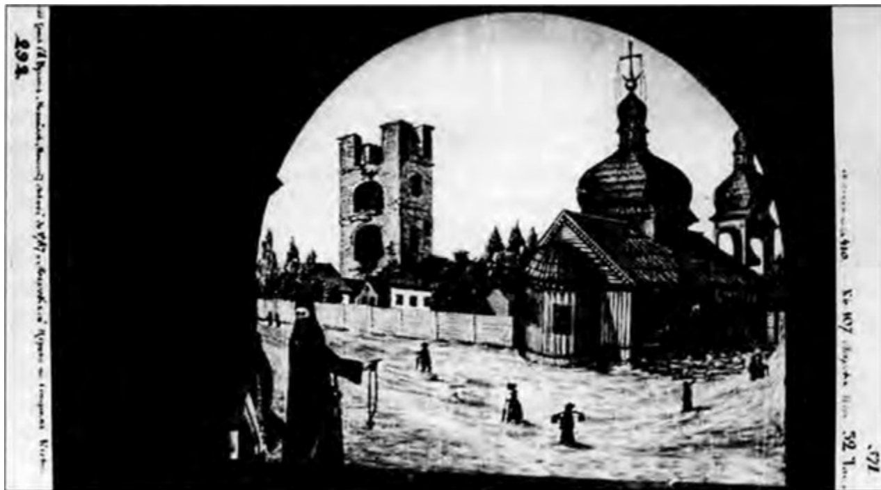
Іл. 6. Церква Покрови Пресвятої Богородиці у Верхньому Києві. Малюнок XIX ст.

зображена окрема (?) двохярусна дзвіниця з великим дзвоном. Наявність на малюнку ліворуч від церкви давньої, зі слідами руйнації, дуже високої трьохярусної цегляної, прямокутної в плані, нікому не відомої вежі лише підкреслює ненадійність цього художнього джерела.