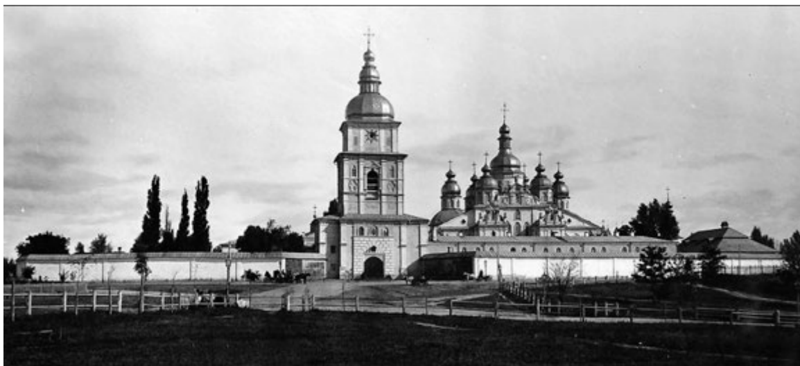
Іл. 2. Площа перед Михайлівським Золотоверхим монастирем. Фото другої половини XIX ст. На передньому плані праворуч – місце Покровської церкви

Місце розташування церкви Покрови Богородиці визначено точно, завдяки численним планам Києва XVIII ст. (1745, 1750, 1768, 1774, 1780, 1783, 1787 та інших років), на яких позначено цю споруду. Вона стояла на початку дороги-узвозу, що вела від Михайлівських воріт (згодом від церкви отримали назву Покровських) Поперечного валу укріплень Верхнього Києва другої половини XVII ст. до Печерських воріт (нині північна частина Майдану Незалежності). Зараз це – непарний бік вул. Михайлівської, а місце самої церкви – частина парку, прилегла до перетину цієї вулиці і Володимирського проїзду (іл. 2; 3).