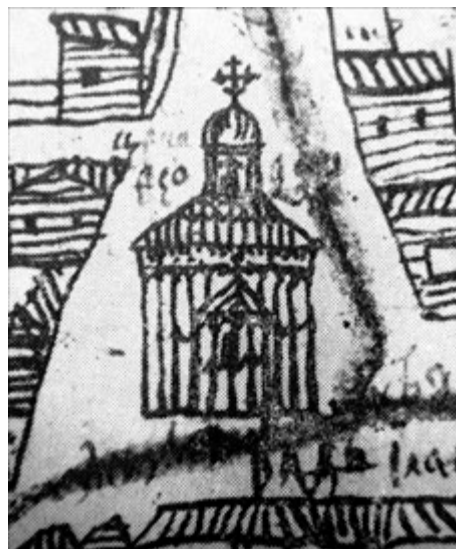
Іл. 1. Церква Святого Феодосія на плані Києва І. Ушакова 1695 року

Іншим свідченням появи Покровської церкви тільки наприкінці XVII ст. є її відсутність у переліку церков Верхнього Києва Розписного списку міста 1695 року [Алфёрова, Харламов 1982, с. 150] і на плані Києва І. Ушакова того ж року. Натомість на цьому плані є зображення церкви Святого Феодосія в Печерському містечку, яку, згідно з цитованою вище інформацією В. Новгородцева, було розібрано, перенесено й знову зібрано у Верхньому Києві, і, відповідно, переназвано та переосвячено. Феодосіївська церква мала апсиду, що завершувалась окремою банею з хрестом, яка за висотою значно поступалась головній бані церкви (іл. 1). На плані Києва Кальнофойського 1638 року ця церква має дещо інший вигляд і розташовану поряд дзвіницю, але таке ж співвідношення висоти центральної та апсидної бань. На місці дерев'яної церкви Святого Феодосія в 1700–1702 роках було побудовано однойменну цегляну, яка збереглася до нашого часу [Сіткарьова 2005, с. 160–161].