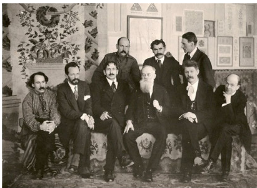
Сидять зліва направо: Абрам Маневич, Олександр Мурашко, Федір Кричевський, голова УЦР Михайло Грушевський, генеральний секретар освіти Іван Стешенко, Микола Бурачек. Стоять: Георгій Нарбут, Василь Кричевський, Михайло Бойчук

На легендарному фото – діячі культури, науки і мистецтва, з ініціативи яких було створено Академію.