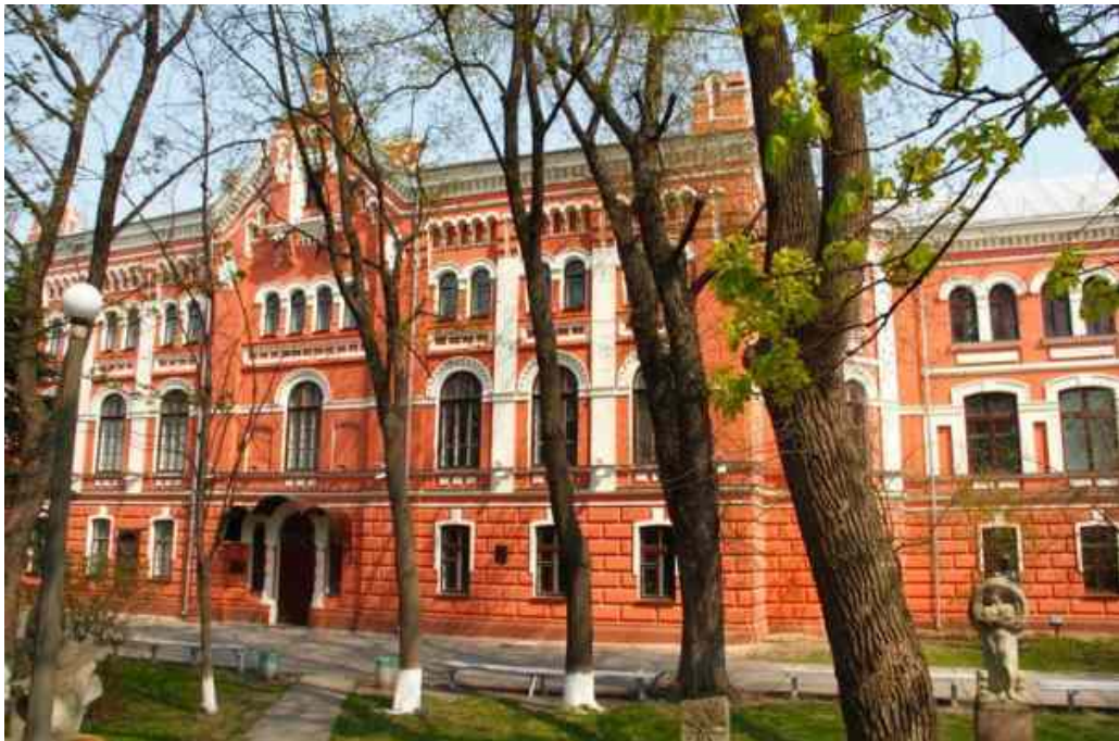
Національна академія образотворчого мистецтва і архітектури (сучасний вигляд)

Незабаром відбулася довгоочікувана подія для української інтелігенції – нарешті вдалося створити Українську академію мистецтв, яка існує й досі як Національна академія образотворчого мистецтва і архітектури (НАОМА). Це був перший виш незалежної держави – Української Народної Республіки (УНР).