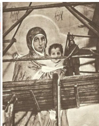
В. Васнецов за роботою