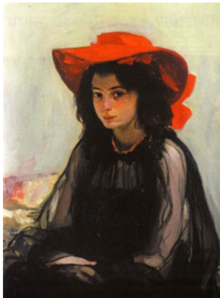
О. Мурашко «Портрет дівчини у червоному капелюсі». 1902–1903 рр.

У Парижі Олександр Мурашко захопився імпресіонізмом. Він спробував відійти від академічної техніки та поєднав різні живописні прийоми, а згодом, надихнувшись стилем модерн, використовував його прийоми в композиції та формотворенні кольорів. Саме у французькій столиці художник створив свою визначну роботу «Портрет дівчини у червоному капелюсі».