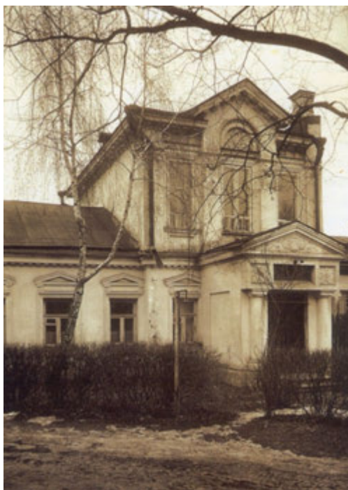
Будинок Олександра Мурашко на вул. Багговутівській, 25 (не зберігся), у який митець повертався в ніч, коли його було вбито