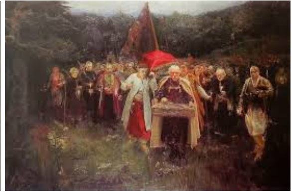
О. Мурашко «Похорон кошового»

Картину Мурашка визнали найкращою серед студентських робіт, і його нагородили відрядженням у Європу – навчатися малювання в провідних живописців Німеччини, Італії та Франції.