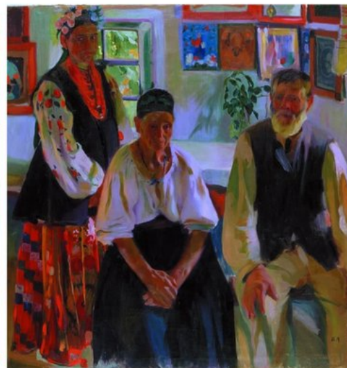
О.Мурашко. «Неділя». 1911 р.