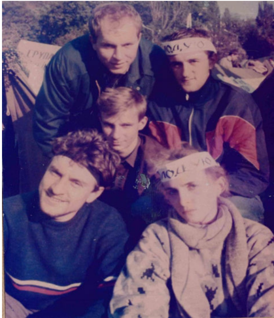
Голодуючі студенти у білих пов'язках та охоронець табору із чорною пов'язкою на голові.