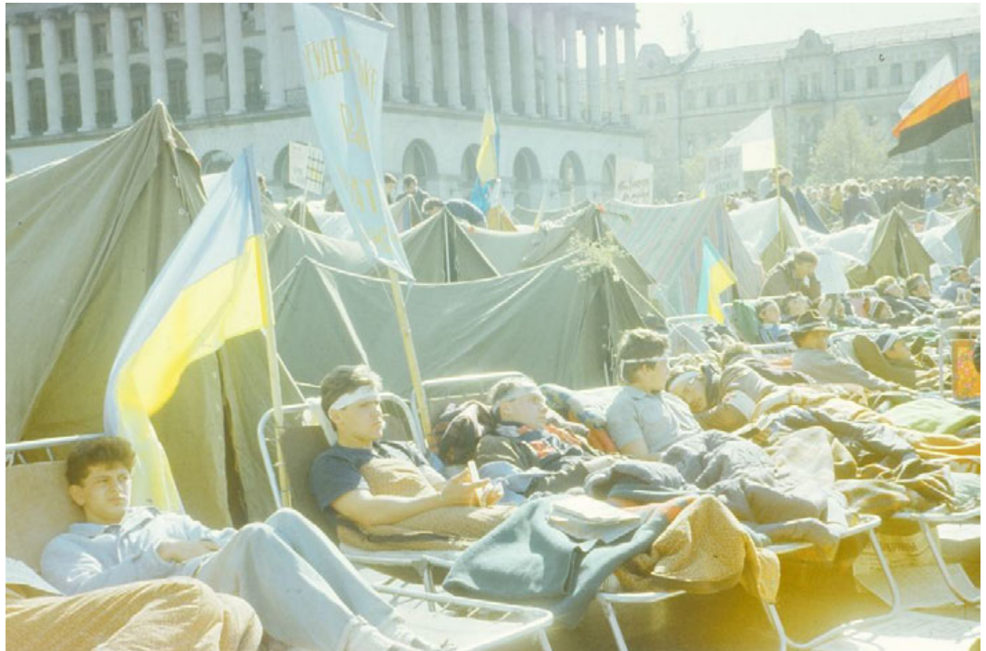
Учасники голодування.

Ще частина учасників носила чорні – ті, хто відповідав за безпеку голодувальників.