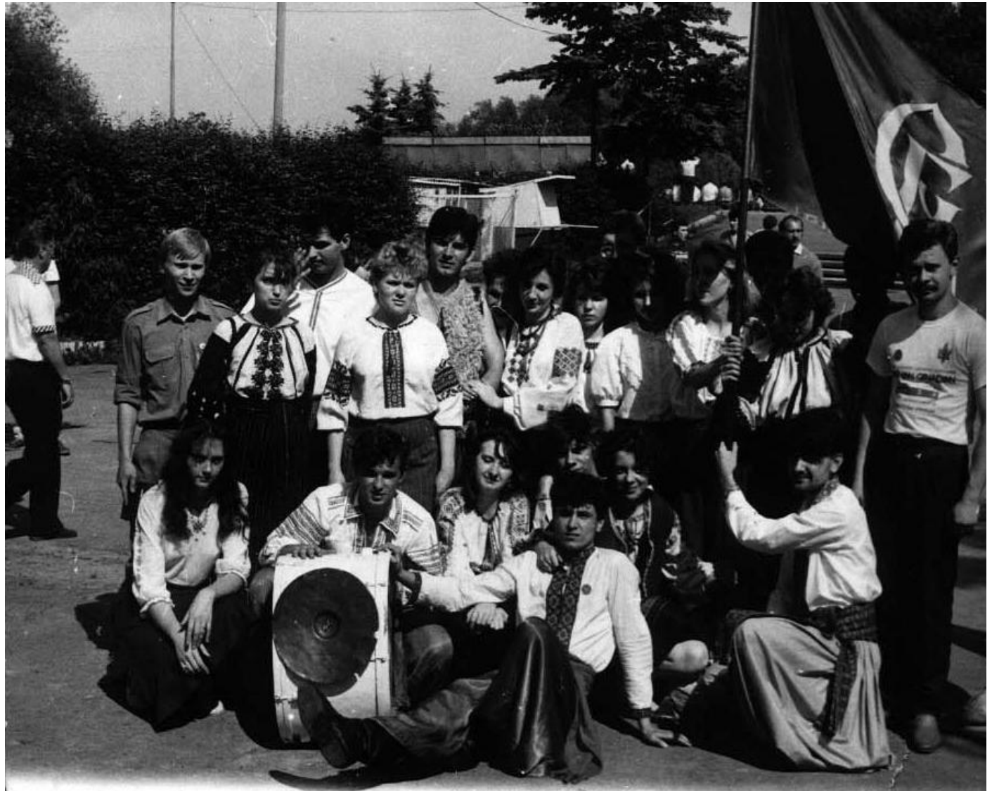
Учасники Студентського братства Львова.

Студентське братство Львова налагодило контакти з іншими українськими студентськими об'єднаннями, зокрема Українською студентською спілкою (УСС). На спільній нараді ухвалили рішення розпочати акції протесту на початку жовтня 1990 року.