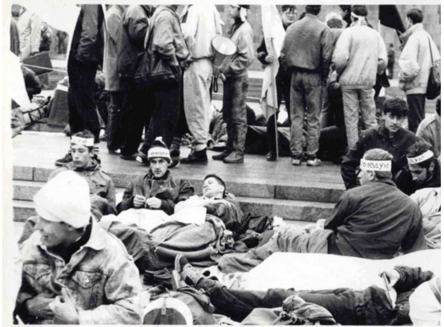
Першій день голодування.

Акцію планували провести під будівлею Верховної Ради. Проте вранці 2 жовтня загони міліції оточили споруду. Частина мітингувальників, які вийшли на площу Жовтневої революції, вирішили розпочати протест там. Увечері на головній площі Києва з'явилося наметове містечко.