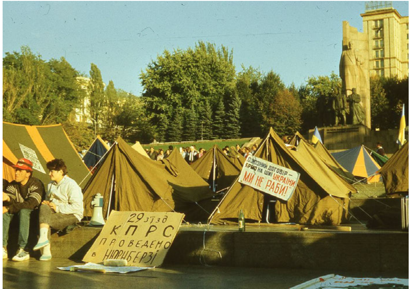
Плакати наметового містечка.