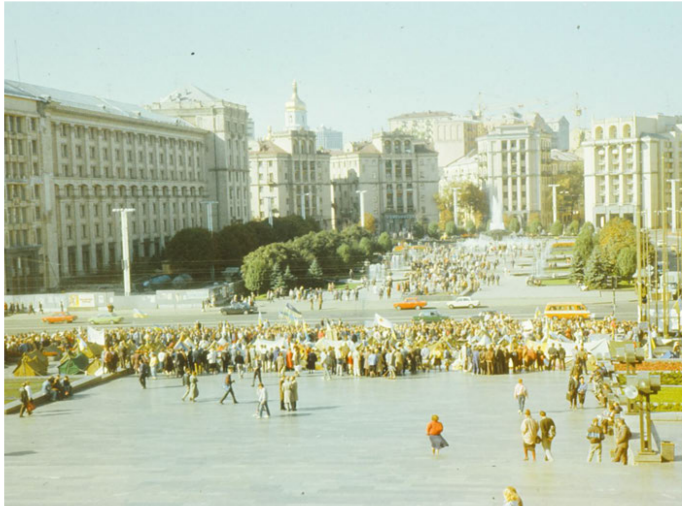
Вигляд табору протестувальників.

Після цього протест, який до того називали Студентським голодуванням на граніті, отримав назву «Революція на граніті».