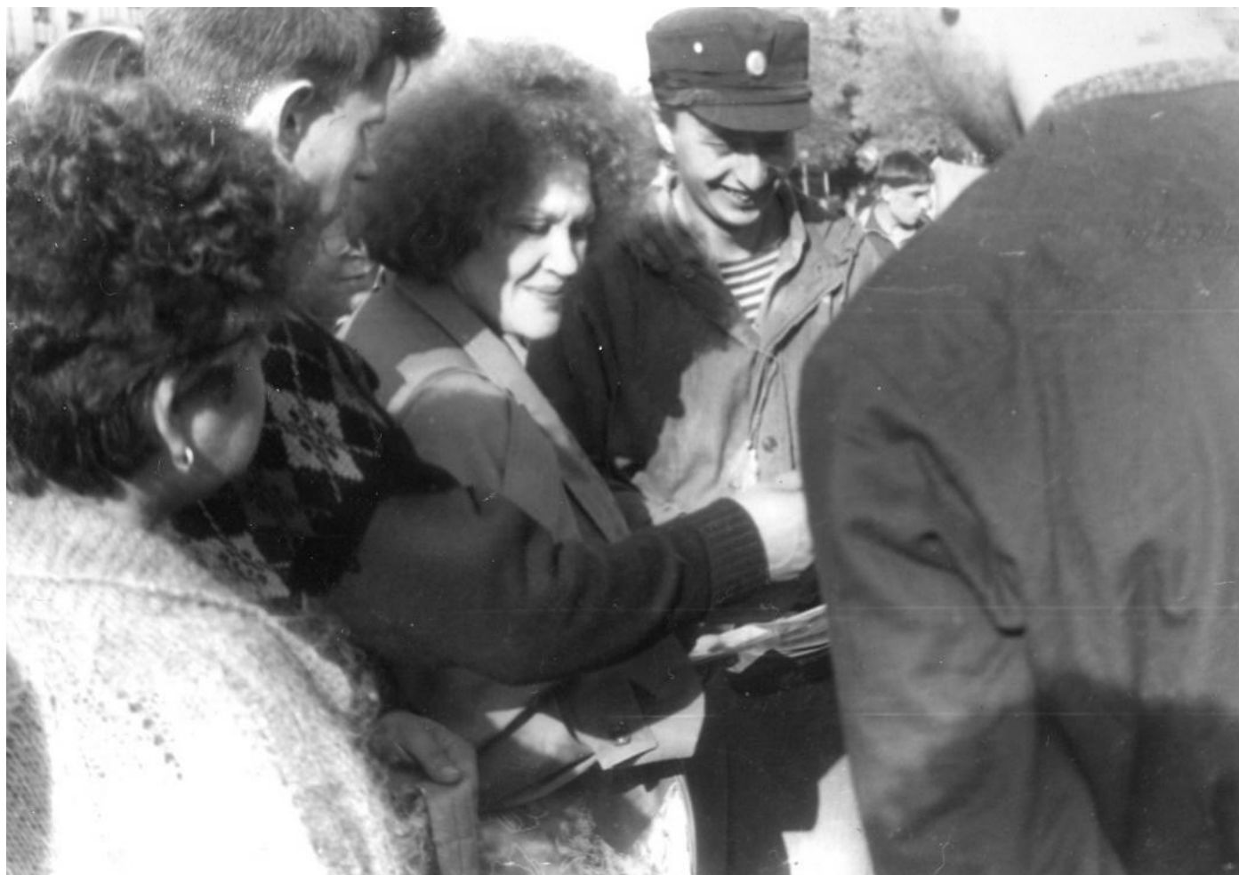
Поетеса Ліна Костенко у таборі голодуючих студентів.