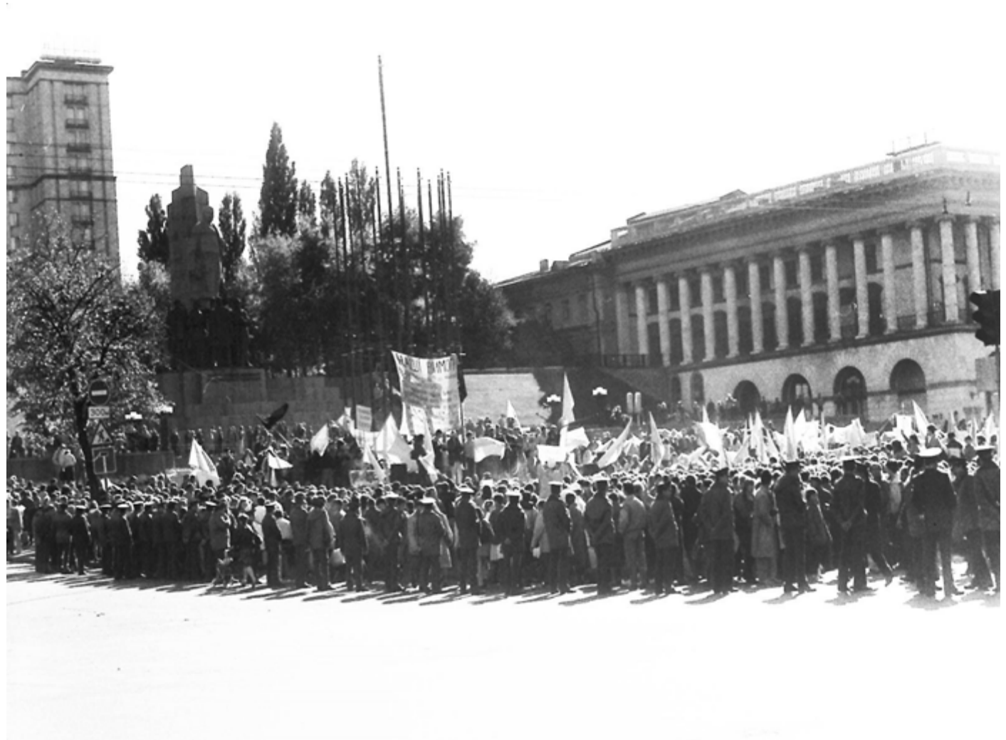
Кордони міліції навколо наметового містечка у середмісті столиці. Вигляд табору протестувальників.

На стрічці, якою був огорожений табір, протестувальники повісили аркуш з написом «майдан Незалежності».