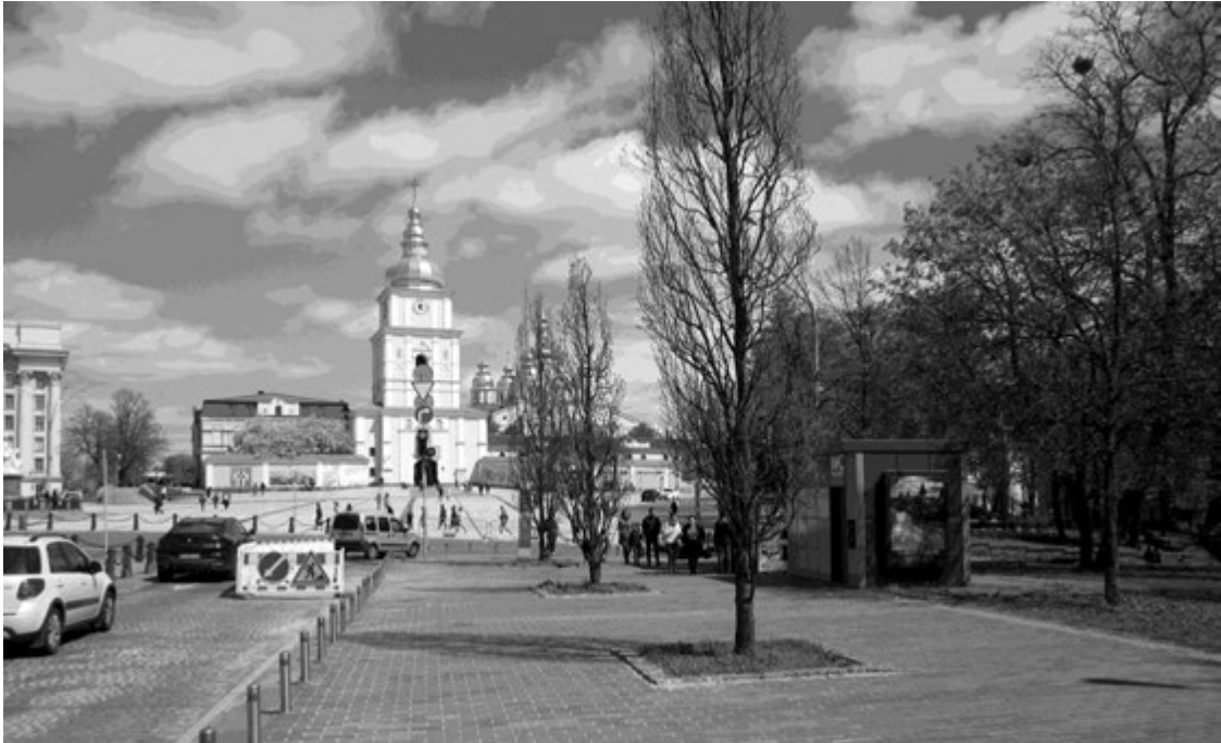
Іл. 3. Місце Покровської церкви. Фото 2021 року

У межах церковної садиби, на захід від церкви, були розташовані будівлі – ймовірно, помешкання причту, які також зображено на деяких планах міста. На південь від церкви, із зовнішнього боку огорожі садиби останньої, стояла криниця, яка обслуговувала як відвідувачів Покровської церкви, так і місцевих жителів (іл. 4).