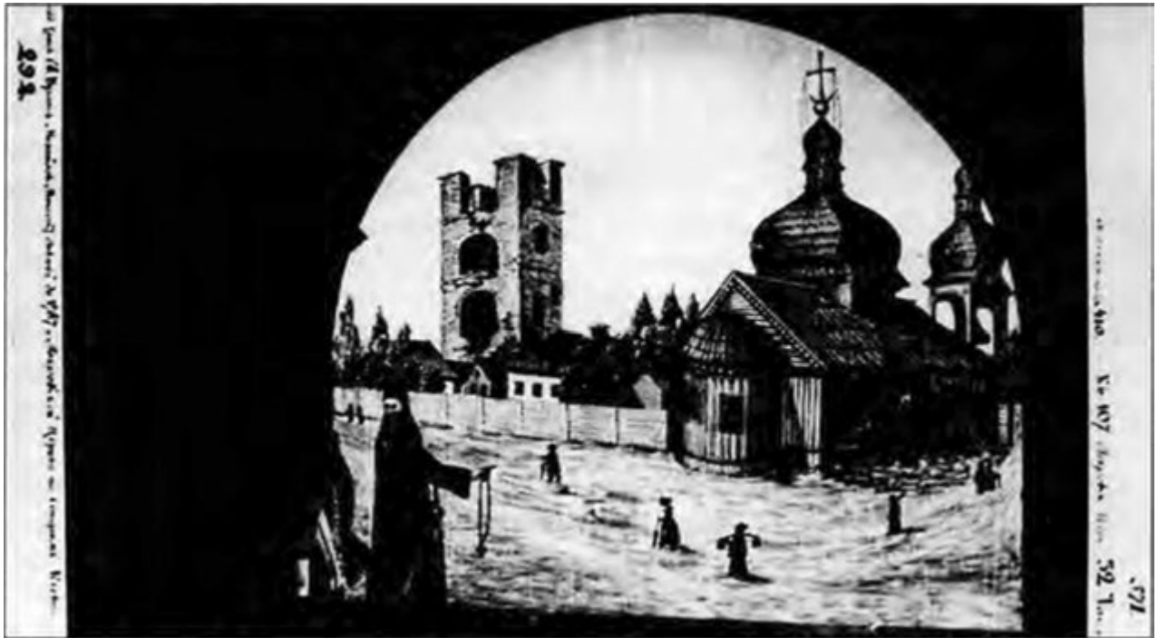
Іл. 6. Церква Покрови Пресвятої Богородиці у Верхньому Києві. Малюнок XIX ст.

зображена окрема (?) двохярусна дзвіниця з великим дзвоном. Наявність на малюнку ліворуч від церкви давньої, зі слідами руйнації, дуже високої трьохярусної цегляної, прямокутної в плані, нікому не відомої вежі лише підкреслює ненадійність цього художнього джерела.