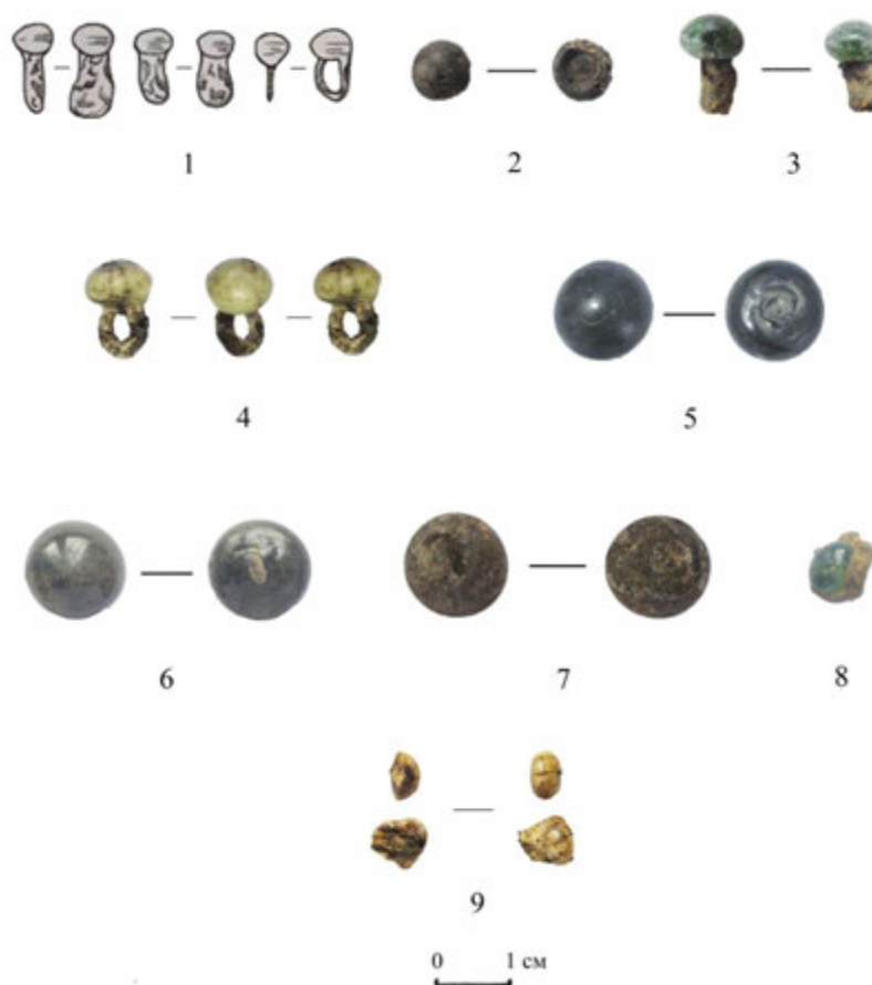
Іл. 1. Скляні гудзики з металевою ніжкою: 1 – розкопки, вул. Костянтинівська, 34, 1989 р. [за: Сагайдак та ін. 1990, табл. XIII]; 2 – розкопки, вул. Спаська, 35, 2011 р.; 3 – розкопки, вул. Оболонська, 11, 1989 р.; 4 – розкопки, вул. Володимирська, 12, 1998 р.; 5–7 – розкопки, вул. Спаська, 35, 2008 р.; 8–9 – розкопки, вул. Спаська, 35, 2007 р. 2, 4–9 – колекція з наукових фондів Інституту археології НАНУ; 3 – колекція Музею історії міста Києва

Два екземпляри гудзиків, що складаються зі скляної кульки поганої збереженості та металевого вушка (розміром 6×11 та 6×13 мм), знайдено в заповненні давньоруського поховання під час розкопок на київському Подолі [Сагайдак та ін. 2004, с. 18, 20, 54]. У цьому ж історичному районі під час дослідження поховання другої половини XV – початку XVI ст. біля черепа було зафіксовано три зразки скляних гудзиків (іл. 1: 1) кулястої форми (діаметром 5×5 мм; 4×6 мм; 5×6 мм і довжиною від 1,0 до 1,2 см) з білого непрозорого скла з металевими вушками [Сагайдак та ін. 1990, с. 20, 25, табл. XIII; Зоценко 2001, с. 175, рис. 9].