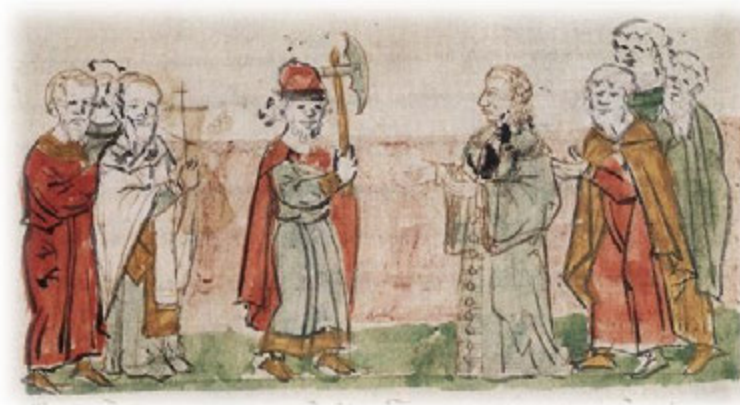
Мініатюра з Радзивілівського літопису. Кінець XV ст.

Гудзик – це деталь одягу, що з'єднує його частини [Щапова та ін. 2007, с. 45]. Таку функцію виконували різноманітні металеві застібки, але з часом археологічно фіксуються й гудзики з металу (бронза, сплав олова та свинцю), а також кістки. У X–XIII ст. ця категорія знахідок набула значного поширення на територіях тогочасних державних утворень у Європі та Передній Азії (серед яких Русь, Волзька Булгарія, Візантійська імперія тощо). На європейських теренах такі металеві вироби представлені кулястими, грибо- та грушоподібними за формою зразками, що їх деякі дослідники пов'язували з ремісничим виробництвом Волзької Булгарії [Казаков 1991, с. 119]. Гудзики з металу зафіксовані в похованнях з X до XIII ст., а іноді трапляються й у пізньосередньовічних комплексах [Бліфельд 1977, с. 43–45; Казаков 1971, с. 141; Козловський, Крижановський 2019, с. 154–155, 159, рис. 508, 5]. Кістяні гудзики в перерізі мали напівсферу чи трапецію, а також могли нагадувати своєю формою пряслиця або ж бути