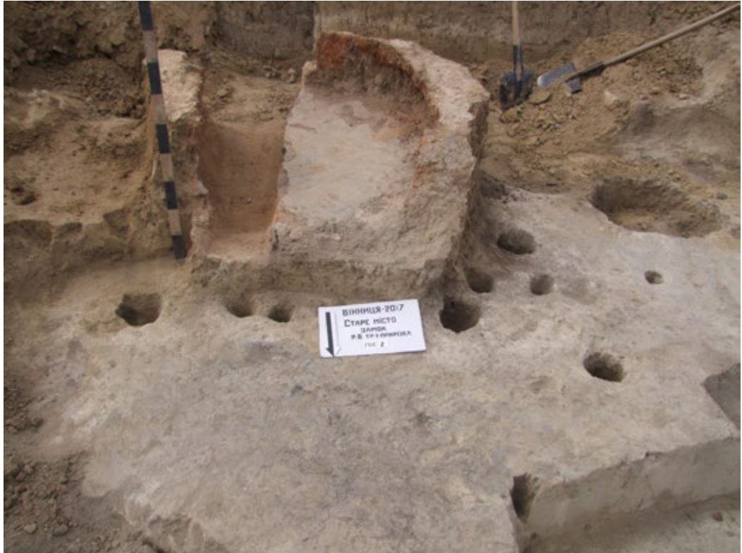
Іл. 1. Вид на піч із посаду. м. Вінниця

У садибі XIII–XIV ст., наприклад, відкрито залишки кількох подібних печей, що розташовувалися одна над другою і були значно порушені похованнями XIX ст. На посаді в Новгороді-Сіверському [Виногородська, 1988, с. 49] також було розкопано житло з глиняною піччю XIII – початку XIV ст., що стояла на материковому останці 0,35 м заввишки і мала «опічок». Він був обкладений дошками, що їх по кутах підпирали чотири стовпи (іл. 2).