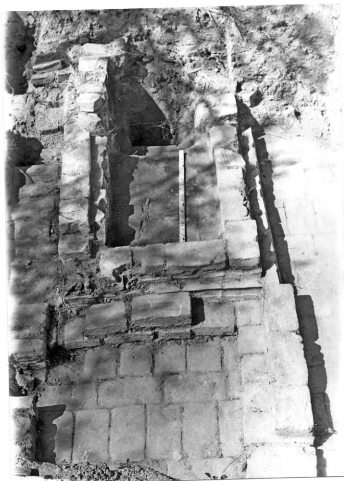
Іл. 4. План груби. м. Чернігів

Опалювальні печі рядових мешканців, про що свідчать археологічні матеріали кінця XVII – середини XVIII ст., робили переважно з глини, вони слугували одночасно для приготування їжі. Невелика кількість кахель, знайдених на підлозі розкопаних жител у Білгородці, а також різноманітність їх типів, дозволяють зробити припущення, що кахлі були некомплектні і вставлялися в облицювання печі на зразок горщикових кахель. Мабуть,