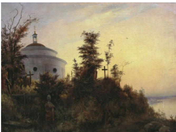
та картина Івана Їжакевича (1913).