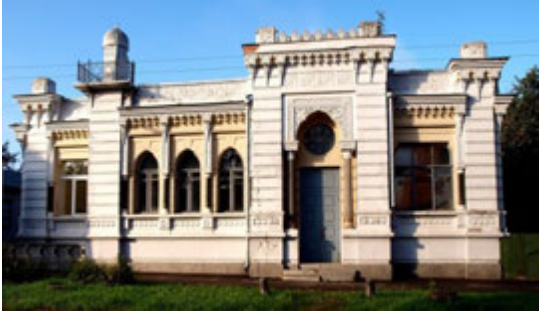
Друга – мавританський особняк Бахмутського.