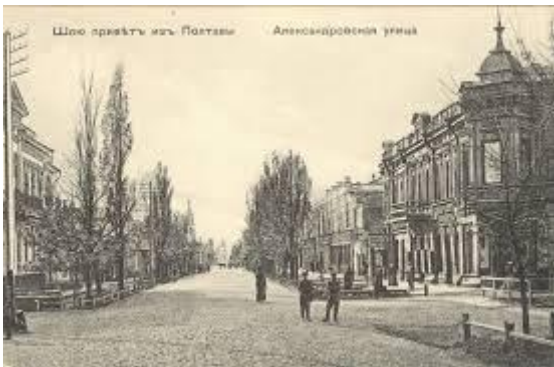
Третя – будинок Варшавського.

Проте, як і раніше, наше завдання – не показати «все». Ця «прогулянка» про інше: обрані будівлі – це не про географію, це про три різні мови міста – мова фантазії, мова екзотики та мова порядку й розрахунку.