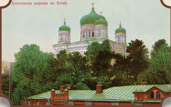
Десятинна церковь въ Києвѣ.

Десятинна церква в Києві. Вигляд з Андріївського узвозу. Відкритий лист. Хромолітографія Києво-Печерської Лаври. 1912 р.