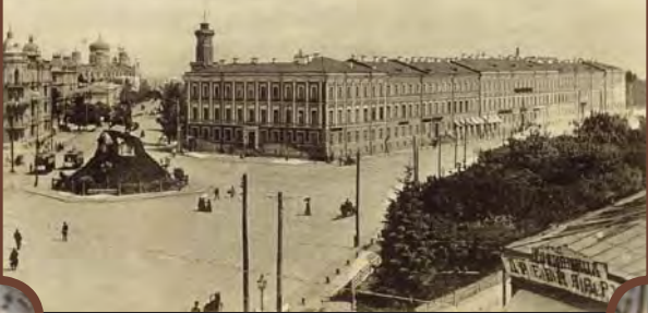
Київ.—Київ. № 41. Присутствених мість.—Les tribunaux.

Присутні містя. Київ. Фототипія Шерера, Набгольця і Ко (Москва)