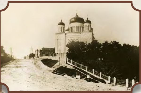
Десятинна церква Різдва Пресвятої Богородиці. Вигляд з «Бабиного торжка». Фотографія. 1880 р.

До сьогодняшнього дня такіе откритки хранятся в частных и государственных коллекциях в Украине, Российской Федерации, Соединенных Штатах Америки и некоторых странах Европы.