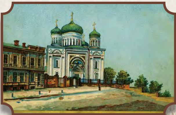
Десятинна церква Різдва Пресвятої Богородиці. Хромолітографія. Кінець XIX – початок XX ст.

Дане видання представляє особливий вид поштових листівок для «відкритих листів», що надсилалися без конвертів. Вони з'явилися у Європі на стику поштової та видавничої галузей. Одним з різновидів ілюстрованих листівок стала «документальна листівка», на лицьовому боці якої було надруковано фотокартку.