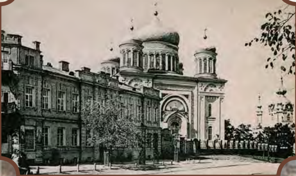
Десятинна церква. Світлодрук. Кінець XIX – початок XX ст.

Нерідко для сучасних дослідників саме поштові листівки є чи не єдиним збереженим джерелом для вивчення вигляду тієї чи іншої місцевості, тієї чи іншої пам'ятки історії та культури. Мета цього буклету – показати інформативну цінність документальних листівок для дослідження архітектурного обличчя Києва межі XIX–XX століть, насамперед Десятинної церкви Різдва Пресвятої Богородиці.