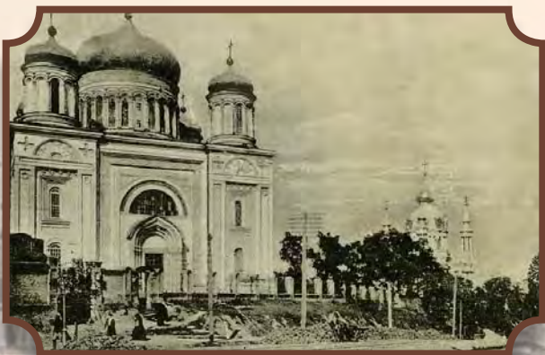
Десятинна церква. Київ. (Dessjatin-Kirche. Kiew). Поштова картка. Кінець XIX – початок XX ст.

Листівки із зображенням «стасівської» Десятинної церкви були поширені не тільки в Російській імперії, а й далеко за її межами. Вони відзначали місце, де колись височів перший мурований кафедральний собор християнської Русі – Десятинна церква Пречистої Богородиці кінця X століття.