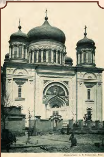
Київ. Десятинная церковь.

Десятинна церква. Київ. 1900 р.