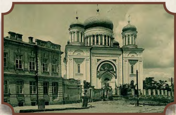
Десятинна церква. Київ. Світлодрук С.В. Кульженка. 1900 р.

Данное издание представляет особый вид почтовых открыток для «открытых писем», которые отправлялись без конвертов. Они появились в Европе на пересечении почтовой и издательской отраслей. Одной из разновидностей иллюстрированных открыток стала «документальная открытка», на лицевой стороне которой была напечатана фотография.