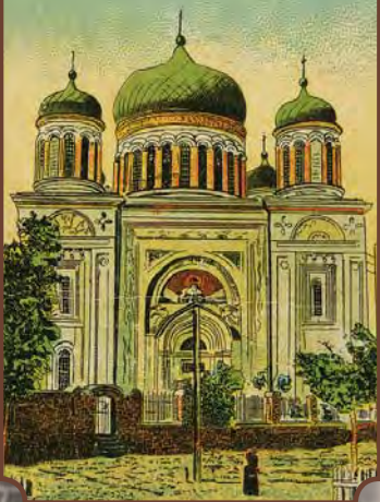
Десятинная церковь въ Киевѣ.

Десятинна церква в Києві. Хромолітографія. Кінець XIX – початок XX ст.